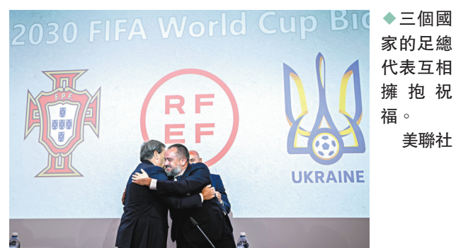
◆三個國家的足總代表互相擁抱祝福。

綜合外電報導 西班牙足總和葡萄牙足總昨天在新聞發布會上公布，烏克蘭足總已加入西班牙和葡萄牙的行列，聯合申辦2030年世界盃足球賽決賽周。西、葡、烏申辦2030年世盃將遇上其他候選方競爭，例如埃及、希臘和沙特阿拉伯之間的合作，以及烏拉圭、阿根廷、巴拉圭和智利的南美聯合提案。