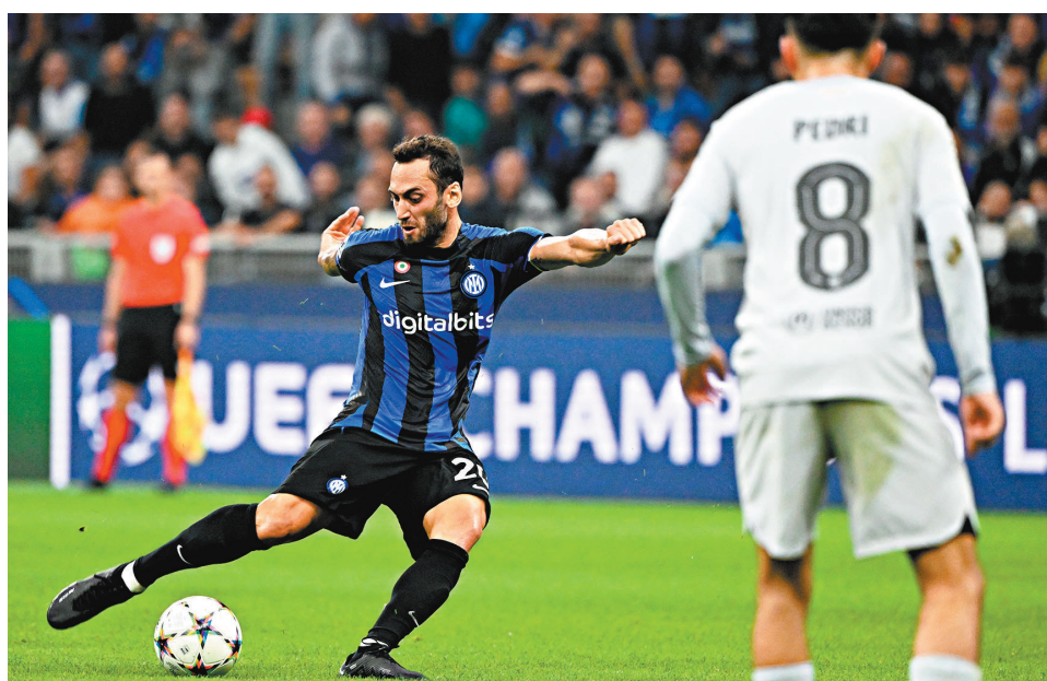
◆查漢奴古遠射破網，為國米奠定勝局。新華社