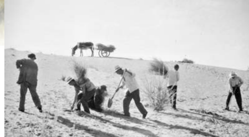
◆八步沙第一代治沙現場（1987年）。受訪者供圖