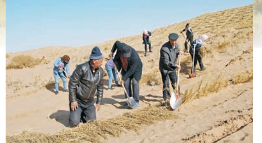
◆八步沙治沙現場（2021年）。