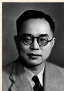
◆1938年，徐鑄成在上海《文匯報》時期。