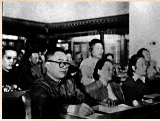
◆1954年8月，徐鑄成參加第一屆全國人大會議。