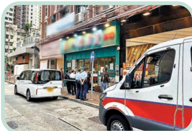
◆警方發現有「黃碼」人士進入餐廳展開調查。