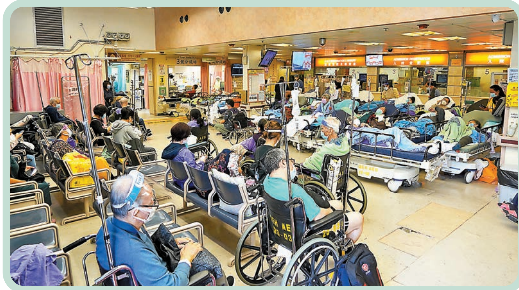
◆高拔陸憂慮香港或面對新冠和流感夾擊，拖垮公營醫療體系。圖為今年第五波疫情高峰期間，新冠患者逼滿伊利沙伯醫院急症室。

她指出，接種新冠及流感疫苗人士，可按需要在兩星期後再接種肺炎鏈球菌疫苗。噴鼻式流感疫苗較適合2歲至49歲人士，但若患有哮喘、抵抗力差及孕婦等，則不適宜使用。9歲以下未曾接種流感針小朋友，則需要打兩針，兩針要相隔4個星期。