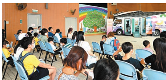
◆參加活動的學生及其親屬在等候區輪候接種新冠疫苗。場學校外展活動。

她表示，特區政府會繼續為學校提供團體預約到社區疫苗接種中心接種疫苗，並提供免費往返接送服務。自9月以來，政府已安排約60間學校以團體預約形式安排學生接種，小學和幼稚園亦已舉辦了約155