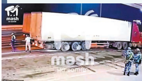
◆網傳裝有炸彈的卡車。網上圖片