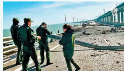
◆俄方派員到爆炸現場調查。