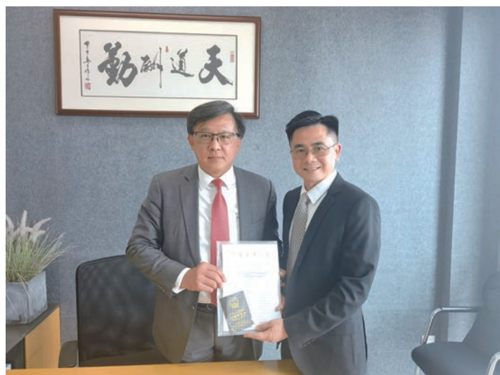
何君堯到廣州律師事務所領證上班。

何君堯議員的社會資源廣泛，熟悉香港和內地法律操作規程，在不同法律領域為客戶提供服務和意見，但他仍然持續不斷學習，不斷砥礪自我奮鬥，他服務社會的歷程，由法律工作、社區工作再到慈善工作，以至鄉事工作，區議會及立法會工作，一切都順理成章，邁步向前，成為青年人的楷模。