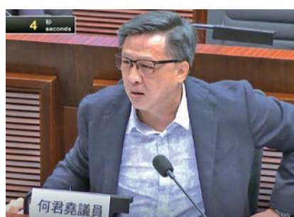
何君堯在立法會會議中為民發聲。

在2022年5月立法會關於醫生註冊條例修訂的會議中，何君堯直言要擺脫西方舊制度，尋求突破！不要讓繁瑣的審核流程成為市民喪失生命的代價！救人更不應受語種限制！「我們應該要急民之所急，要全面保障市民，要強化我們的醫療系統。」何君堯希望新人事新作風，在新局長的領導下，加快步伐做好醫生註冊，制訂一個KPI，在何年何月之前，可以招聘到多少名海外醫生，甚至內地醫生來港，加入醫療系統，為市民工作。