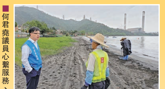
何君堯議員心繫服務、