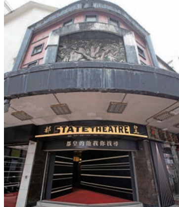
■新世界發展將高規格保育皇都戲院，在傳承建築核心特徵的同時，亦將繼承皇都作為演藝文化地標的功能，並注入新的文化精髓。

香港的第五波疫情令社會整體服務體系面對極大壓力，經過奮戰，香港疫情緩和，社會生活逐步復常。在抗疫途中，鄭志剛一直留意事態發展，多次動用集團資源協助香港渡過難關：除了捐出土地興建方艙醫院、借出暖爐為候診病人送暖、騰出會展作抗疫物資倉庫之用外，他還成立了全港首個大型捐贈配對平台「Share For Good 愛互送」，集合超過200家企業和60間非牟利機構的力量，以科技將有心人捐贈的物資和善款，精準送到每戶有需要的家庭手中，令每個市民在危急時刻都得到最合適、合時的援助，切實提升社會物資的派發效率。