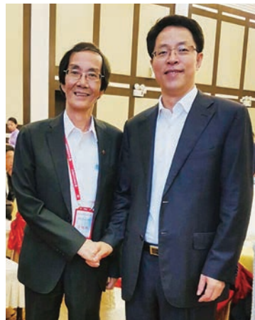
■簡植航博士與時任香港中聯辦主任張曉明合照。