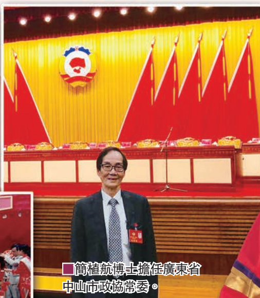
■簡植航博士擔任廣東省中山市政協常委。