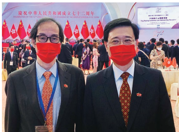
■2021年，簡植航博士與時任政務司司長李家超在慶祝中華人民共和國成立七十二周年酒會合照。