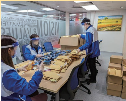
■Covid 19疫情肆虐初期郵寄自助檢測包給有需要市民。