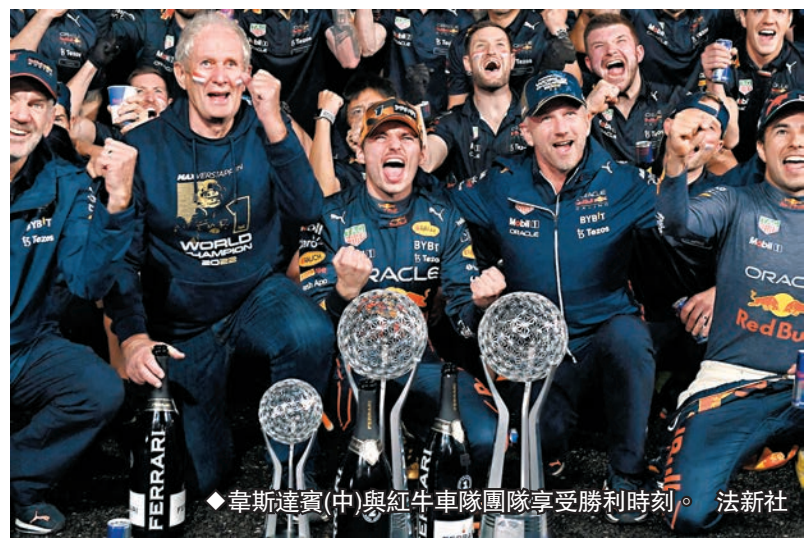
◆韋斯達賓(中)與紅牛車隊隊友享受勝利時刻。