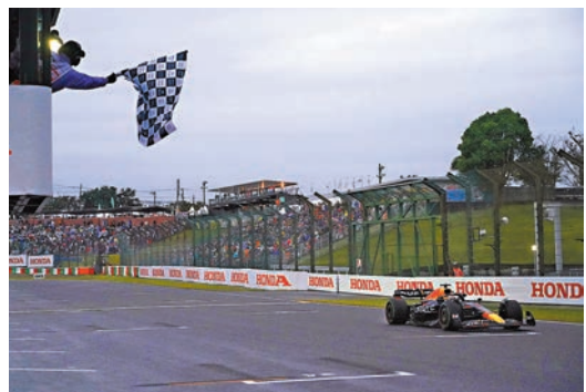
◆昨天鈴鹿賽道的雨戰，最後由韋斯達賓順利率先衝過終點。

這是韋斯達賓本賽季的第十二個分站冠軍，總分達到366分，領先暫列第二的佩雷斯113分，超出排名第三的勒克萊114分。本賽季只剩四站比賽，佩雷斯和勒克萊即使任何人全部獲勝也無法挑戰韋斯達賓的領先地位，後者連續第二年贏得年度車手總冠軍。這位荷蘭車手賽後說：「我很信任這個團隊，亦真的很期待在未來幾年我們能獲得更多勝利，當然還有可能是更多的冠軍。」 時隔8年，曾造成法國車手比安基死亡的危險一幕再次發生在鈴鹿賽道，辛斯撞車導致一塊廣告牌倒下擊中紅牛二隊車手加斯利的賽車，車頭頂着廣告牌的加斯利返回維修站。由於能見度差，賽道上紅旗揮動表示比賽暫停，賽會出動安全車引導所有車輛開回維修站。但當車輛依然在賽道高速行駛時，一輛處理辛斯事故車的吊車出現在賽道上，加斯利被迫涉險超越，他在賽車上通過無線電大發雷霆，稱這樣的事情「無法接受」。