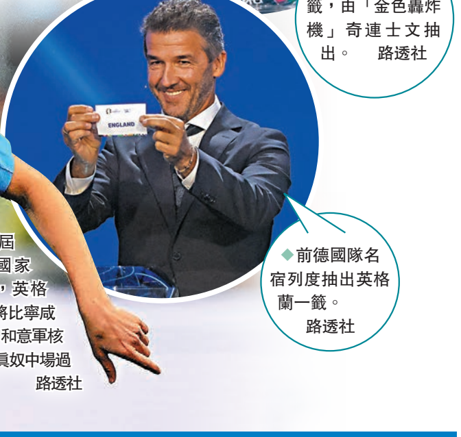
◆前德國隊名宿列度抽出英格蘭一籤。