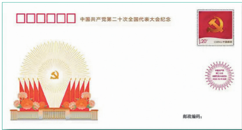
◆《中國共產黨第二十次全國代表大會》紀念封。

香港文匯報訊（記者 趙一存 北京報道）中國郵政集團有限公司官網消息，《中國共產黨第二十次全國代表大會》紀念郵票、郵品將於2022年10月16日起發行。其中，紀念郵票自10月9日起，首日封、紀念封等7款