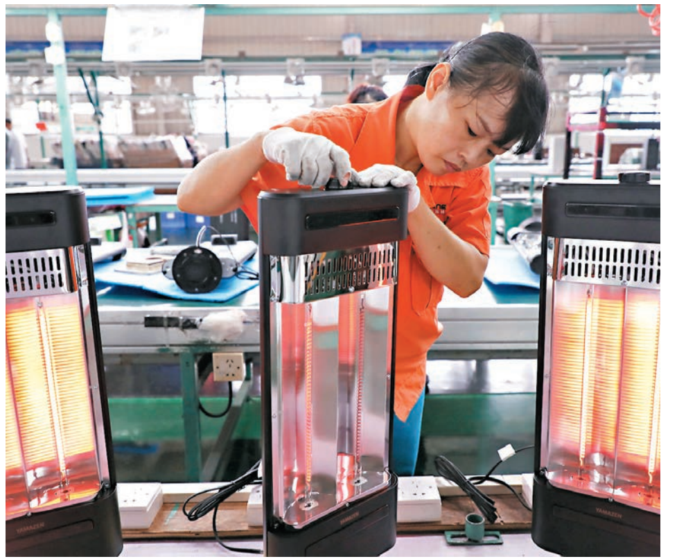
◆過去十年，中國市場主體總量達1.63億戶，相比2012年底的5,500萬戶，淨增超1億戶。圖為廣東順德一些家電企業預估到歐洲供暖市場的新需求，調整產品結構，靈活研發新產品適應市場的取暖需求。

數據顯示，2020年以來，中國市場主體繼續保持增長，淨增3,700多萬戶，佔到過去十年淨增總量的35%，經濟展現更大韌性。