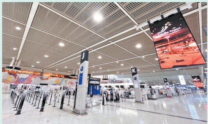
▲成田機場人流稀疏。