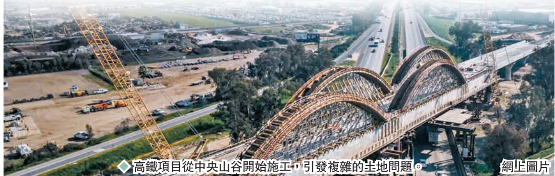
◆高鐵路項目從中央山谷開始施工，引發複雜的征地問題。