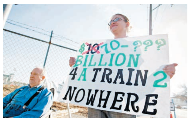
◆民眾在當年高鐵動工儀式上抗議。

隨着美國開始一場耗資1萬億美元（7.84萬億港元）的基礎設施建設熱潮，建設美第一條高鐵系統的艱難努力成為一個負面案例，這個曾經「雄心勃勃」的公共工程項目因政治交易、不切實際的成本估算及有缺陷的工程，最終變成「大得不能倒」。圍繞該項目的許多問題，都與希望鐵路通過其城市和地區的不同政治人物有關。