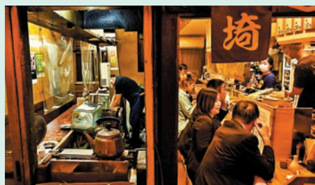
▲日本服務業缺乏人手，影響旅遊業復甦。網上圖片