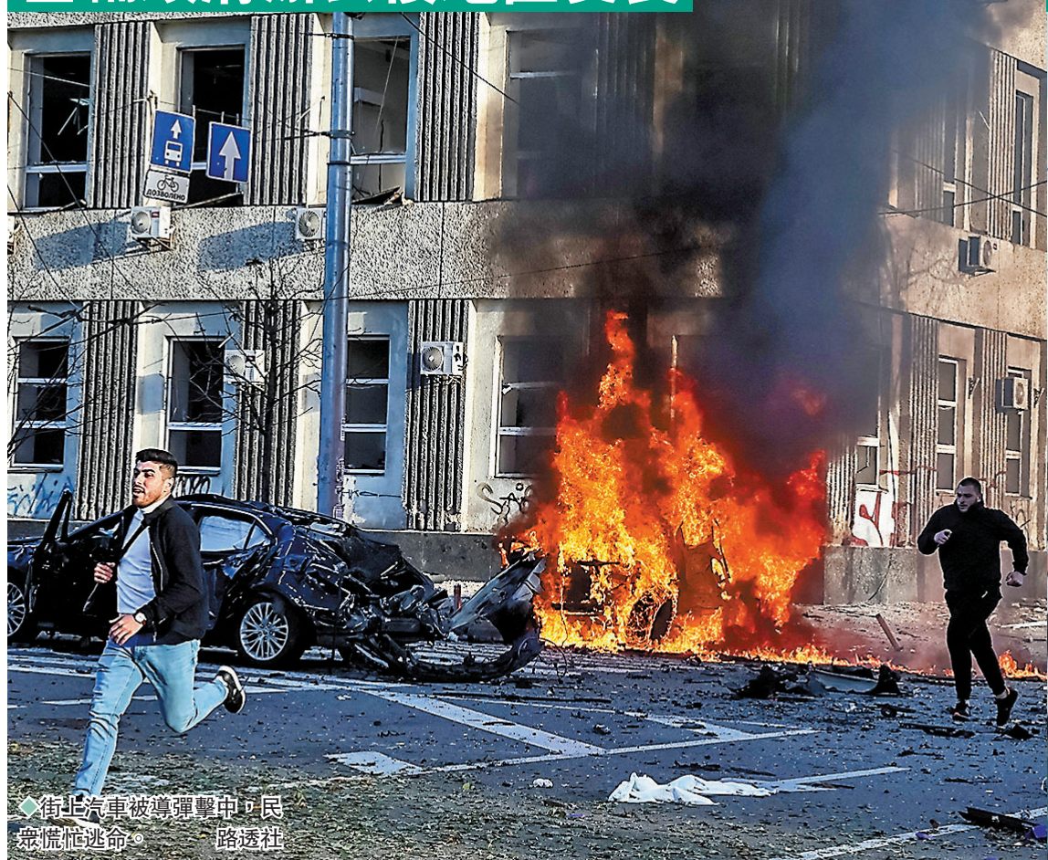
◆街上汽車被導彈擊中，民眾慌忙逃命。