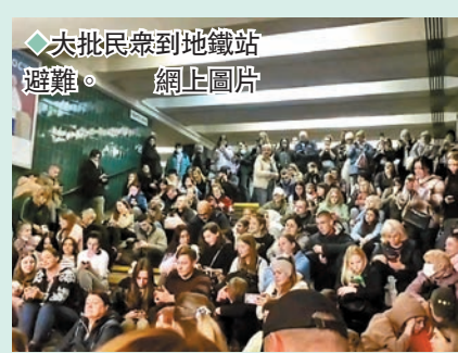
◆大批民眾到地鐵站避難。網上圖片