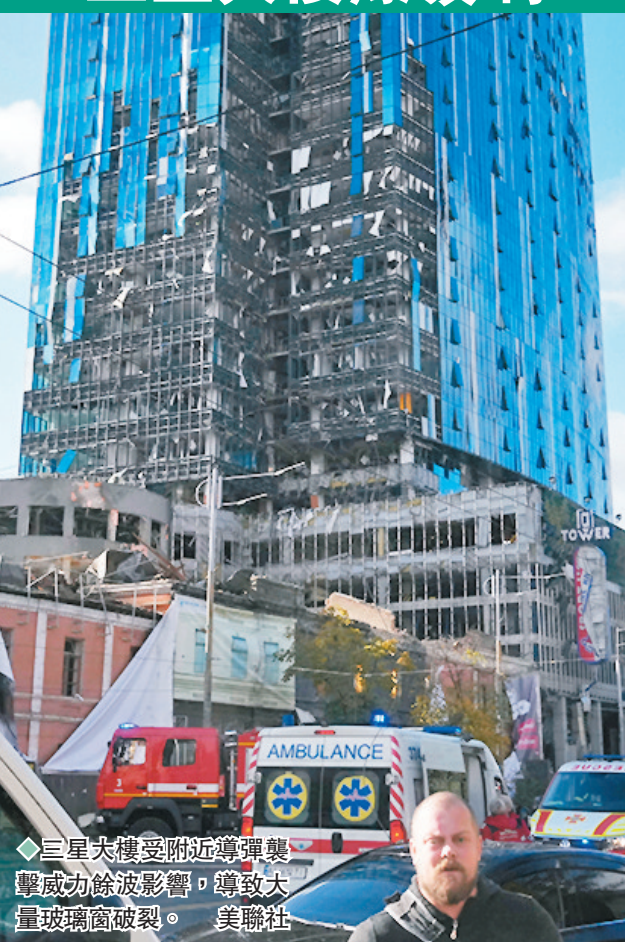
◆三星大樓受附近導彈襲擊威力餘波影響，導致大量玻璃窗破裂。