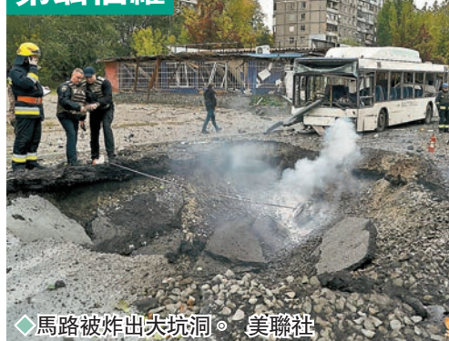
◆馬路被炸出大坑洞。