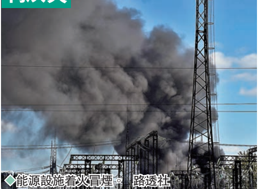
◆能源設施着火冒煙。