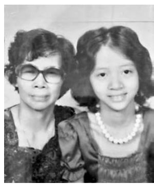
◆梅媽媽強調阿梅非患癌，只是抑鬱所致。

「我明年3月100歲，我祝世界和平人人有工開，家宅孫孫平安，希望乖孫們和我做生日，不用我自己做了。關於個仔，我開過觀音他會唔會再做好人，如果他有所改變就好了。我常夢見他們3個一起傾談，不過我最開心阿梅同我講，『阿梅你唔使擔心，我有落到地獄』，聽後我覺得好開心，鬆一口氣。」