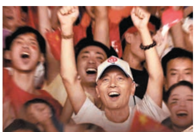
◆電影《我和我的祖國》其中葛優主演的《北京你好》，最令我共鳴！

感謝香港電台31台的《周末大電影》，上週選上了這部近年難得的好電影，讓我重溫，就算熒幕縮小了，亦同樣感人好看。這是一部取材新中國成立70年來發生的開國大典、中國第一顆原子彈、中國女排奪冠、香港回歸、北京奧運、神舟十一號、閱兵典禮等歷史事件，講述普通人與國家之間息息相關的動人故事片。其中最令我共鳴的是葛優主演的《北京你好》，因為我當時也身在北平，獲邀出席了2008年的「奧運開幕禮」，感同身受！