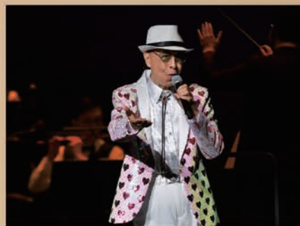
▲葉振棠演唱首本名曲《忘盡心中情》。