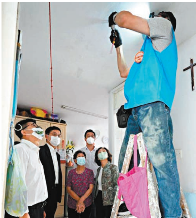
◆家居維修大使昨日前往秀茂坪邨開展服務，居民感激義工的付出。

「愛心前行在觀塘」活動由香港廣東社團總會九龍東地區分會、香港福建社團聯合會九龍東分會、香港海南社團總會九龍東區委員會、香港廣西（九龍東）服務中心、香港浙江省同鄉會聯合會九龍東服務中心，以及民建聯觀塘支部及工聯會觀塘地區服務處協辦。同時得到香港中國企業協會、招商局集團職工聯誼會、中國太平洋慈善基金會、越秀企業（集團）有限公司、中華電力及中華煤氣支持舉辦。