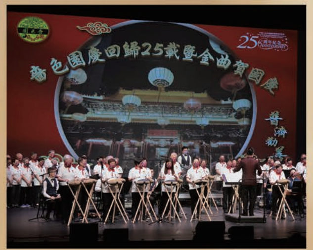
▲晉色園屬下耆英鄰舍中心80多位長者及社區義工以忘憂鼓演奏《晉色園社會服務之歌》。

晉色園去年慶祝創園一百周年紀念，兩度舉辦「金曲妙韻賀百載」音樂欣賞會，深受長者歡迎。今年特於金曲晚會安排了全港首隊忘憂鼓隊，由晉色園屬下可樂耆英鄰舍中心的長者及社區義工組成，聯同可富、可頌兩間耆英鄰舍中心負責合唱的長者共80多位，演奏名曲《往事只能回味》及《晉色園社會服務之歌》，而《往事只能回味》更由晉色園可樂耆英鄰舍中心一位87歲婆婆領奏歌曲的前奏。忘憂鼓的聲音通透空靈，令人感覺恬靜閒適，彷彿能把煩憂一掃而空。忘憂鼓隊與紫荊樂團眾樂師攜手演出，獲得全場熱烈掌聲。