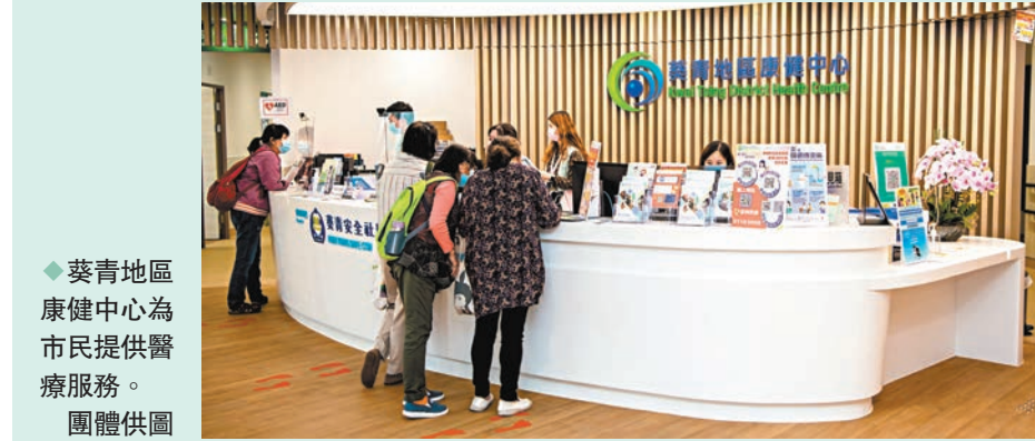
◆葵青地區康健中心為市民提供醫療服務。