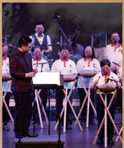
▲晉色園可樂耆英鄰舍中心一位87歲婆婆領奏《往事只能回味》前奏。