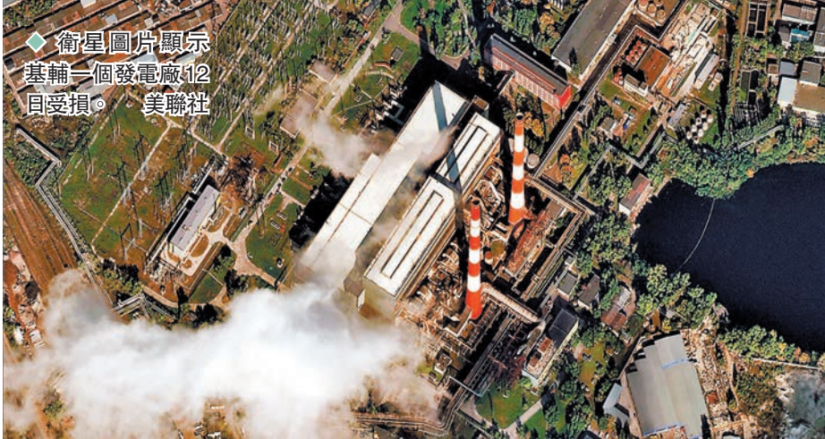
◆衛星圖片顯示基輔一個發電廠12日受損。

美國防長奧斯汀在會上表示，將加快交付承諾的NASAMS防空系統。英國昨日表示將向烏提供防空導彈，並將首次提供