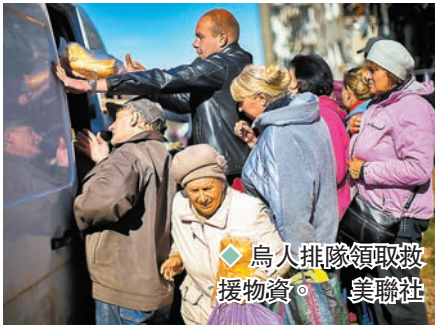
◆烏人排隊領取救濟物資。