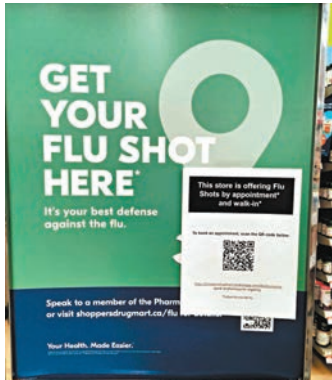
◆多倫多大型連鎖藥房提供流感疫苗接種服務。