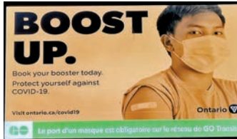
◆加拿大呼籲民眾盡早接種二價新冠疫苗。