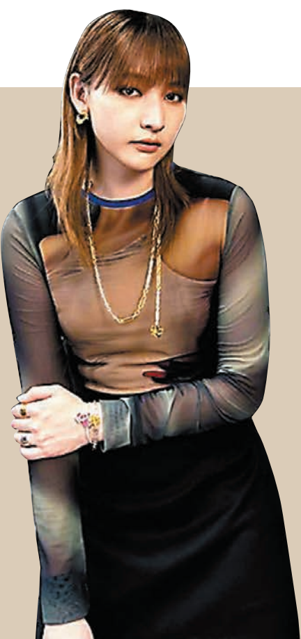
◆ Keith Haring x Pandora 聯名系列

近日，不少首飾品牌推陳出新，推出全新特有新系列，當中有品牌與藝術家合作推出聯名系列，亦有飾物進行疊戴配搭，藉以襯托出與眾不同的個人風格；還有的設計則將嶄新品牌融入新一代人生态度，帶來新世代熱烈追捧重金屬感的銀器飾品，突顯個人品味外，更散發出強烈的冒險精神，為一貫追求簡潔輕奢的系列設計提供更多佩戴的可能性，輕易配搭出截然不同的個人風格。