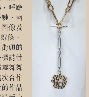
◆ 雙色金屬扭動人像 T 字扣項鍊