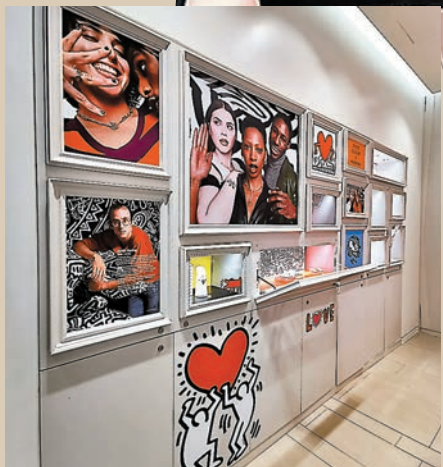
◆ 店舖限定設計融入藝術作品