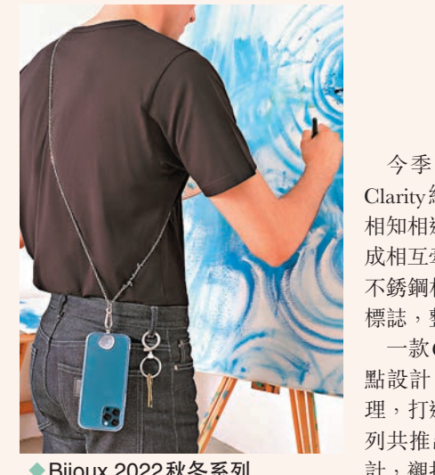
◆ Bijoux 2022 秋冬系列