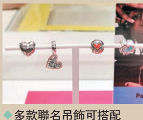
◆ 多款聯名吊飾可搭配