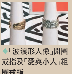
◆ 「波浪形人像」開圈戒指及「愛與小人」粗圈戒指