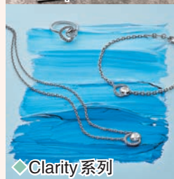
◆ Clarity 系列