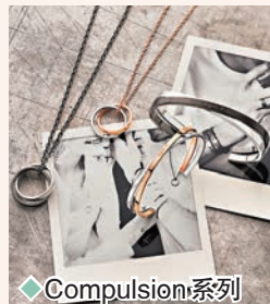
◆ Compulsion 系列

一款 Clarity 系列單品則以純銀製造，以水滴形 b. 字標誌點綴作為重點設計，並以施華洛世奇水晶環繞襯托。b. 字標誌表面經過錘打處理，打造出明暗不一的凹凸花紋，優雅呈現天上朵朵白雲的美態，系列共推出四款單品，包括戒指、耳環、項鍊及手鏈，簡約大方的設計，襯托女性的柔美亮麗。