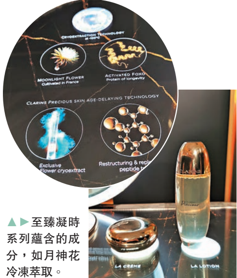
▲ 至臻凝時系列蘊含的成分，如月神花冷凍萃取。