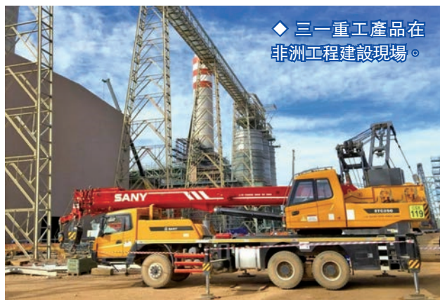
◆ 三一重工產品在非洲工程建設現場。

「中歐班列山河智能專列從長沙出發駛向歐洲，相較海運縮短運輸時間20多天，運輸成本也降低了，還大大降低了我們出口創匯的周轉期限。」山河智能工作人員介紹。