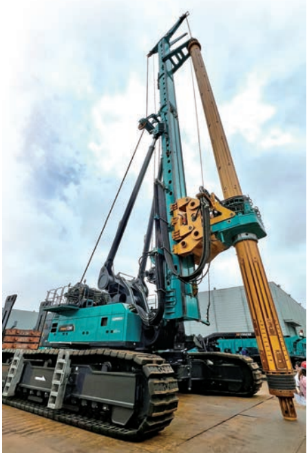
◆ 山河智能生產的全球最大的超級旋挖鑽機。