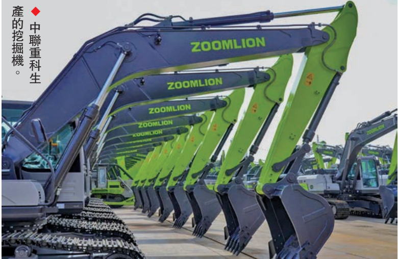
◆ 中聯重科生產的挖掘機。