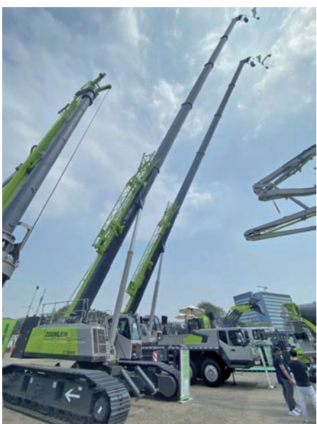
◆ 中聯重科產品在印尼國際採礦現場。

長沙工程機械「四大金剛」，三一、中聯、山河、鐵建，如今全部進入全球產業50強，長沙已成為僅次於美國伊利諾伊州、日本東京的世界第三大工程機械產業集聚地。產業規模連續12年居全國第一。