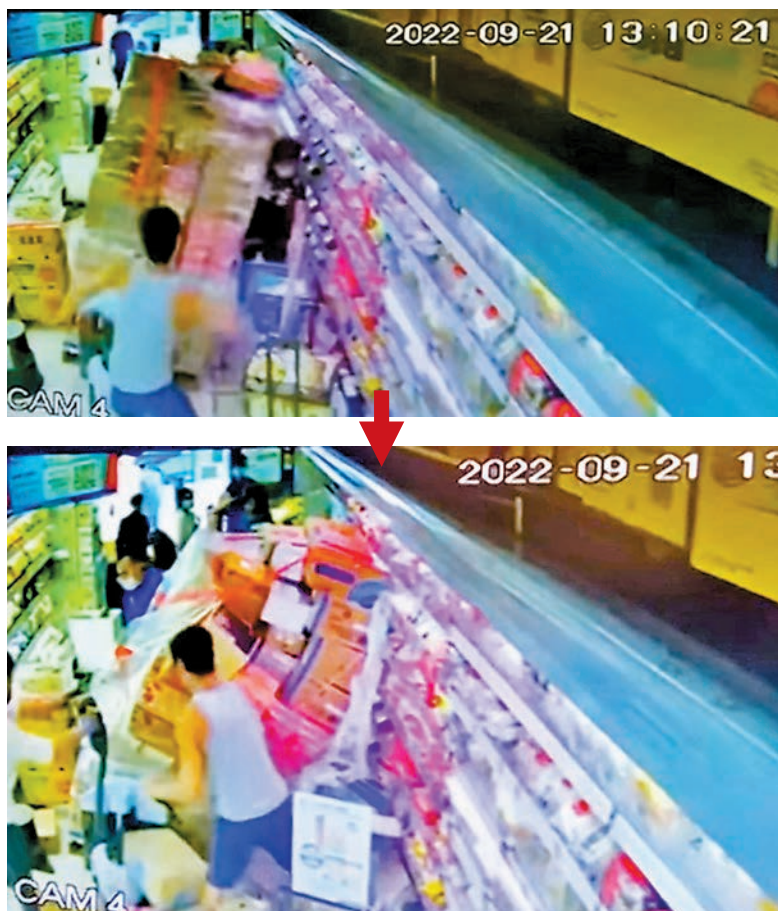
男工運貨物期間，貨物突然倒塌「活埋」女顧客，男工大驚撕開保鮮膠紙將貨物搬出救人。視頻截圖

發言人強調，百佳一向注重職業及店舖環境的安全，對此事件的發生深感抱歉，並會檢討運貨流程並與相關公司再作跟進，避免再次發生同類事件。