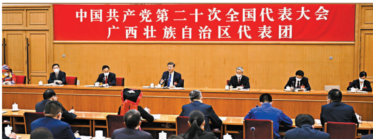
◆習近平昨日參加二十大廣西代表團討論，現場氣氛熱烈。