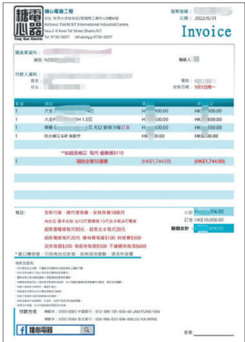
◆受害人與糖心電器工程的交易紀錄。

消委會發現，不少在香港營運的「先買後付」平台公司總部都設置於海外，增加協商解決問題的難度，平台與商家權責亦不清，在有爭議時容易互相推搪責任。消委會總幹事黃鳳嫻指，香港有9個「先買後付」平台，3個由銀行營辦，而由銀行營辦的「先買後付」服務須遵從金管局信貸產品規定，但幾個主流「先買後付」平台非銀行營辦，不受金管局的個人信貸產品指引約束，亦未持有放債人牌照，她呼籲消費者使用服務之前，要分清楚銀行或非銀行平台保障方面的分別，留意個人權益。