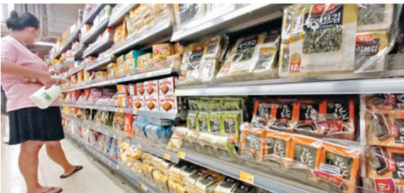
◆消委會測試市面27款即食紫菜發現，個別樣本碘含量過高。

「白子」品牌。此外，「Topvalu」紫菜不僅碘含量最高，鈉含量亦超標最為嚴重，每100克含4,840毫克鈉，超出世衛標準7倍。消委會提醒，經常食用高鈉食品，會增加患高血壓風險。