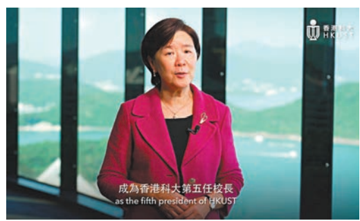
◆葉玉如履新，成為科大首位女校長。

衛生防護中心表示，在深水埗區共收集的107個環境樣本已完成化驗，全部對類鼻疽核酸檢測呈陰性反應。綜合流行病學和環境調查，認為初步可排除傳播與食物或產品有關，亦未有證據顯示個案的感染源頭來自自來水。