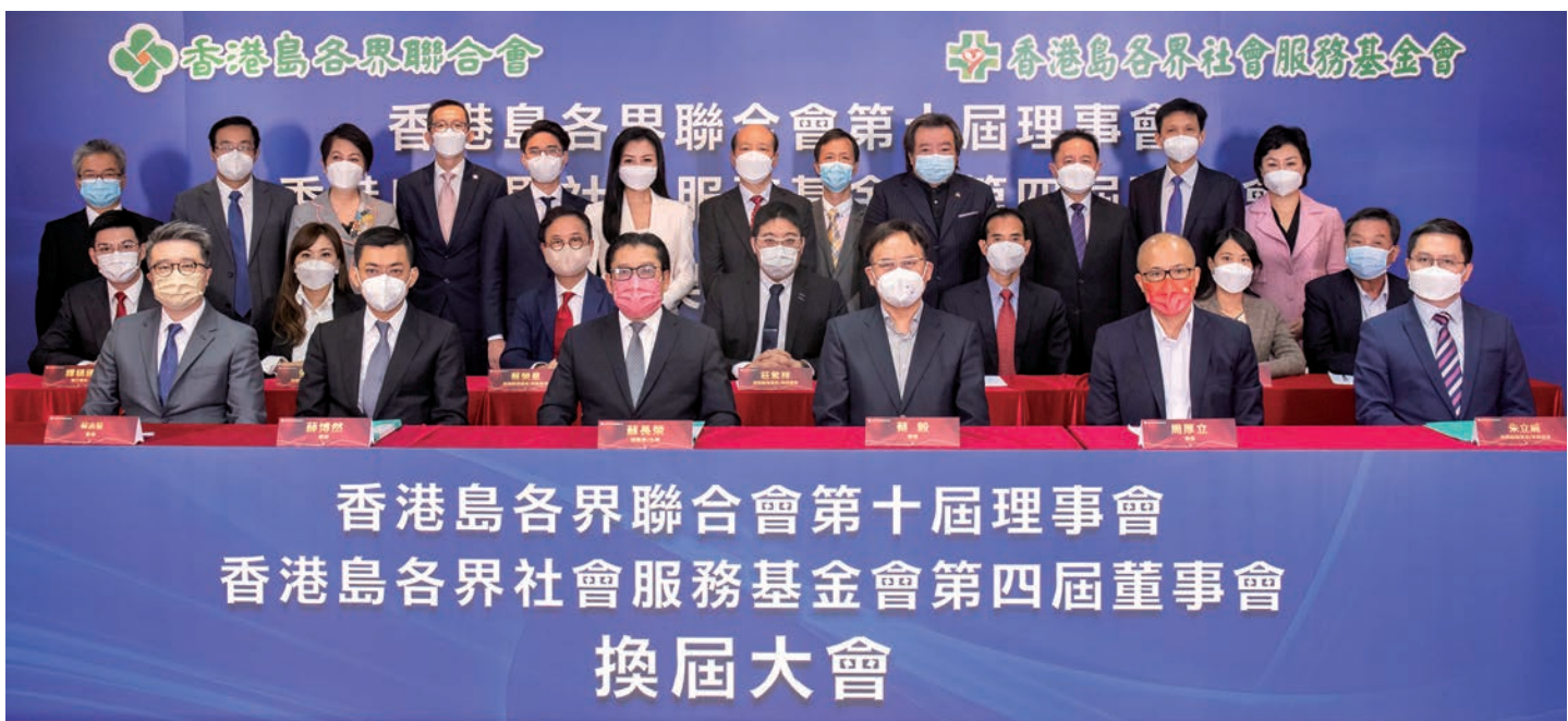
◆香港島各界聯合會第十屆理事會、香港島各界社會服務基金會第四屆董事會換屆大會成功舉辦。

他表示，將竭盡心帶領新一屆理事會、新一屆基金會凝聚各方力量，在新的征程上團結奮進、擔當作為，並着力在以下幾方面推動港島聯的發展：一是