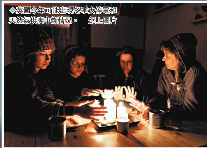
英國今年可能出現冬季大停電和天然氣供應中斷情況。

《衛報》稱，目前不清楚英國政府是否參與BBC這份秘密緊急廣播稿的製作。負責監督國家電力供應的英國國家電網此前罕有地發出警告，指今年冬天的電力供應將面臨風險，如果俄羅斯完全切斷對歐洲的天然氣供應，在最壞情況下，英國每天將停電最多3小時。