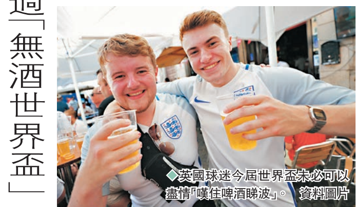
英國球迷今屆世界盃未必可以盡情「嘍住啤酒睇波」。 資料圖片