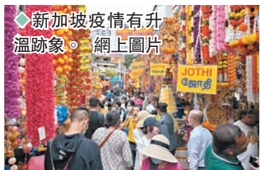
新加坡疫情有升溫跡象。