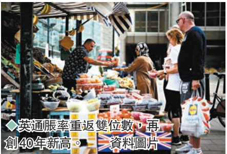
英通脹率重返雙位數，再創40年新高。

英國國家統計局昨日公布，9月份消費者物價指數(CPI)按年升10.1%，高於8月份的9.9%，重返雙位數，再創40年新高。9月份通脹高於市場預期，主要受食品