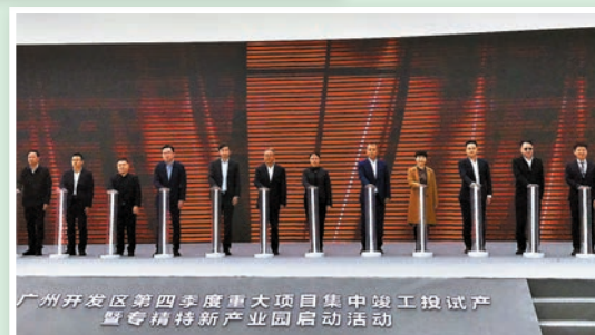
▲ 由國資管理公司運營，規劃和打造集中連片的企業入駐的園區，吸引和匯集重點領域項目、企業，是廣州的重要做法。