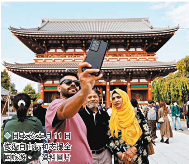
◆日本於本月11日恢復自由和支援全國旅遊。資料圖片

日本厚生勞動省前日公布的統計數據顯示，在截至本周三的一周內，日本新增新冠確診病例約為24.8萬例，是此前一周的1.35倍，相隔兩個月再次呈現增長趨勢。據統計數字顯示，日本於本月11日恢復自由和支援全國旅遊啟動後，感染人數隨即上升，本周