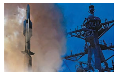
◆SM-6防空導彈最大射程400公里。