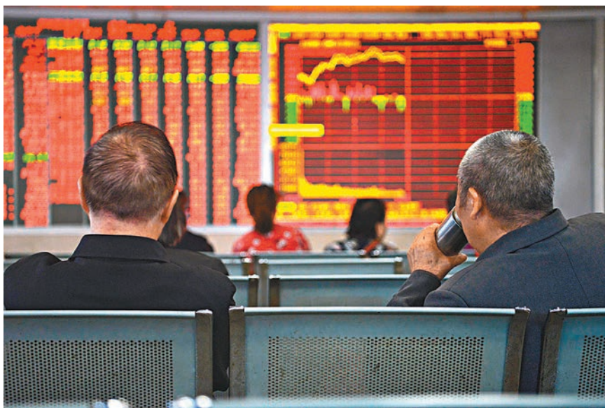
◆A股主要指數昨日表現分化。不過受轉融資費率下調的消息刺激，證券板塊普遍上升。圖為成都某證券行。

ETF) 質押回購交易進一步擴容，其中，上交所宣布新增政金債ETF。另外，兩大交易所均宣布，可用於質押回購的債券ETF，同時包含單市場和跨市場品種。