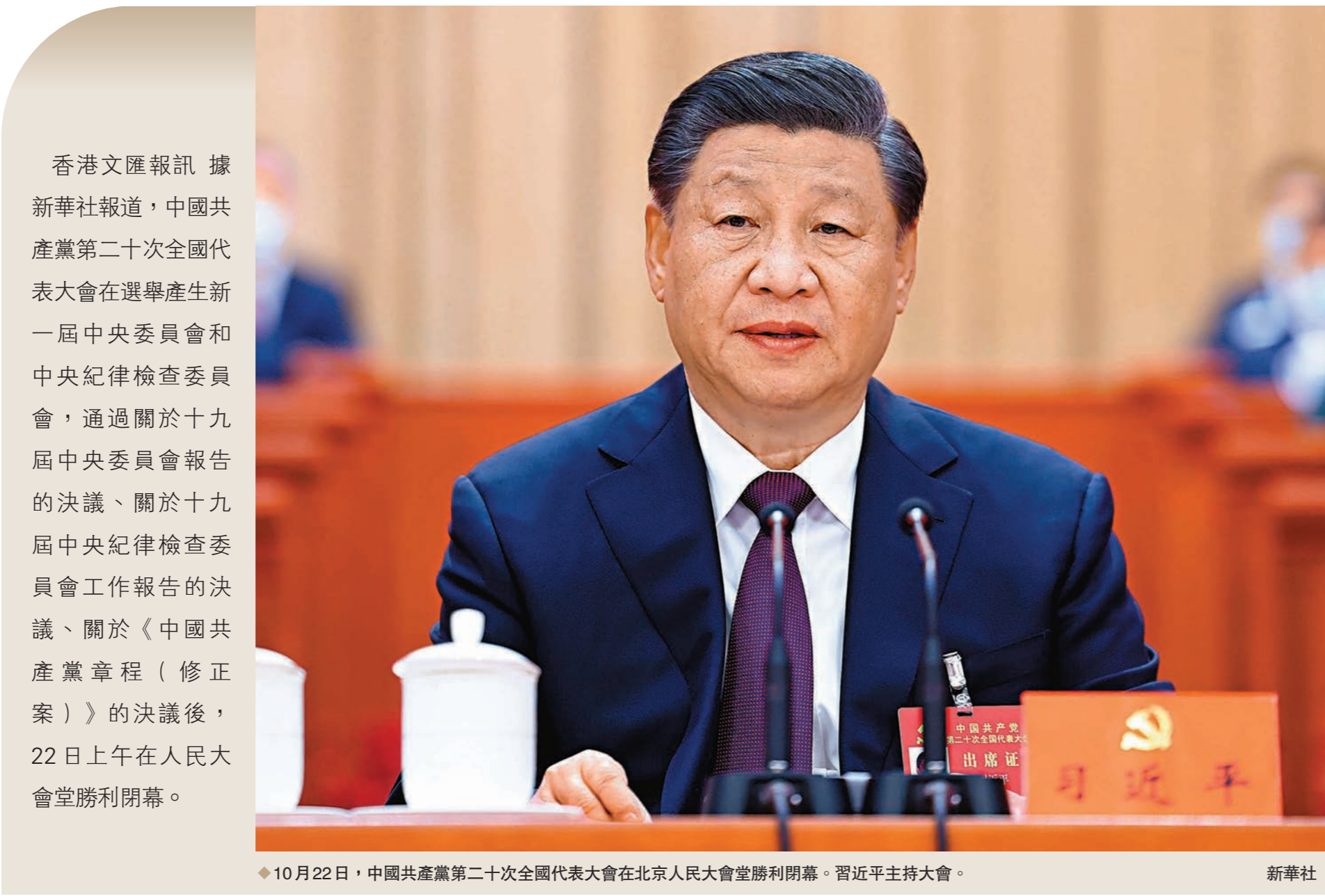
◆10月22日，中國共產黨第二十次全國代表大會在人民大會堂勝利閉幕。習近平主持大會。