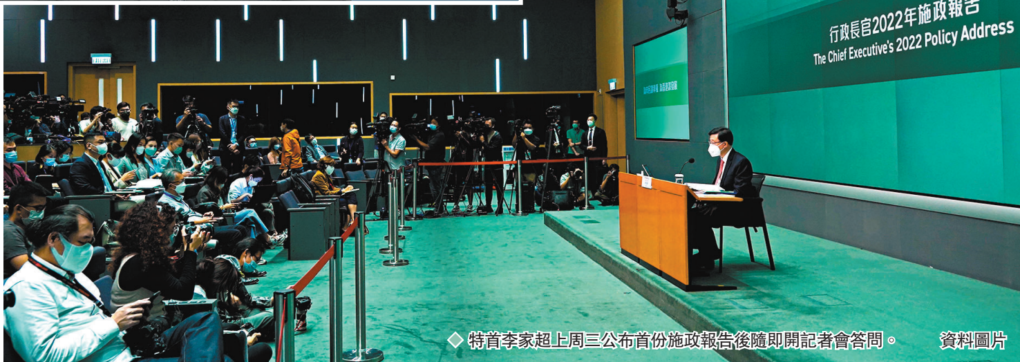
◆特首李家超上週三公布首份施政報告後隨即開記者會答問。

另外，隔離設施部分只是臨時性，沒有獨立廁所，部分則屬應急目的而建，需要經常修補，必須先整體去研究設施的用途，但不會抹殺任何可能性。