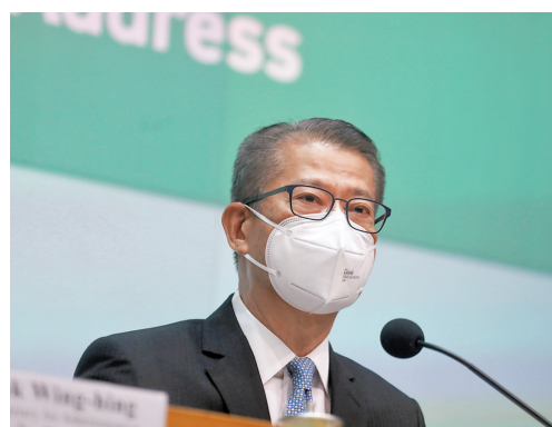
◆財政司司長陳茂波形容，施政報告着力破解香港社會和經濟發展所面對的制約和難題。

他指施政報告在創科發展、吸引重點企業及人才方面有不少新政策、新措施，特區政府將特別設立專責的辦公室或團隊，一站式處理和跟進相關個案，確保能夠具體、扎實地實現施政報告提出的工作目標。