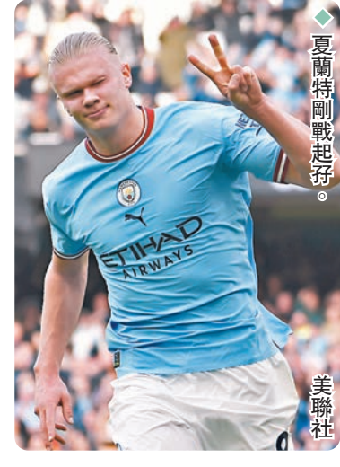
◆夏蘭特剛戰起鋒。

位年輕「後輩」基奧雲尼雷拿、莫高和艾迪耶耶門射術。傷兵滿營兼中場奧斯簡停賽將影響多蒙特的贏波機會。 車路士「薩」敵不容易 E組7分領跑的車路士將作客6分的奧地利球會薩爾斯堡(Now643台周三0:45a.m.直播)，車仔在英超連和賓福特及曼聯保住模達連帥印後的不敗身，但薩軍歐聯4戰的不敗身也不易攻破，同組AC米蘭則作客同積4分的薩格勒布戴拿戴(Now645台周三3:00a.m.直播)。H組法甲巴黎聖日耳門與葡超賓菲加都有8分，3分排第3的祖雲達斯是役作客擊敗賓菲加保住出線希望的機會不高(Now646台周三3:00a.m.直播)。