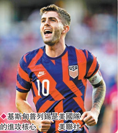
◆基斯甸普列錫是美國隊的進攻核心。