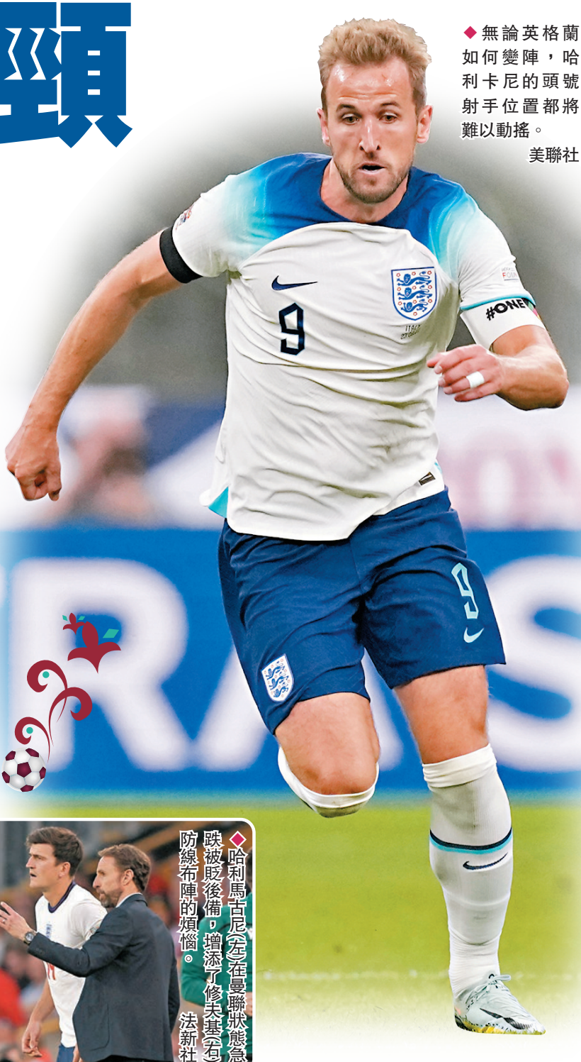
◆無論英格蘭如何變陣，哈利卡尼的頭號射手位置都將難以動搖。