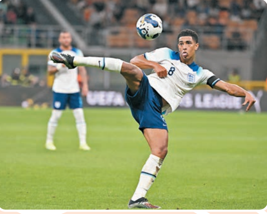
◆比寧威今季在多蒙特狀態理想，有助他守住正選，亦是修夫基可予信賴的生力軍。