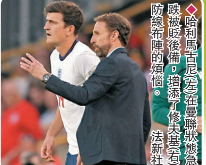
◆哈利馬古尼(左)在曼聯狀態急跌被廢後，增添修夫基急防線布陣的煩惱。