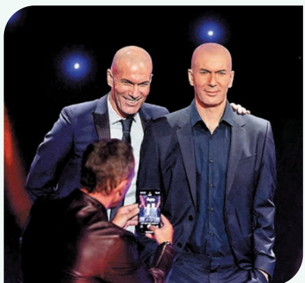
◆施丹日前現身巴黎一家蠟像館，為以自己肖像塑造的蠟像揭幕。

綜合外電報道 帶領皇家馬德里贏得歐聯三連霸的法國名宿施丹，近日接受當地傳媒訪問時證實，自己已將重返教練崗位：「我很快便會回來，再等一下，很快，我離再次執教不遠了。」據外界估計，施丹最有機會是在世界盃後接掌法國國家隊，而其前球會祖雲達斯由於成績欠佳，亦是施丹可能的另一落腳地。