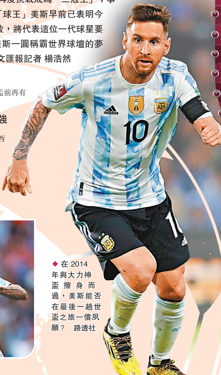
◆在2014年與大力神盃擦身而過，美斯能否在最後一週世盃之旅一償夙願？