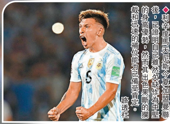
◆利辛度馬天尼斯今夏加盟曼聯後，已證明自己雖然欠缺作為中堅的身高優勢，然而其出色果斷的攔截和迅速的補位能力已備受肯定。