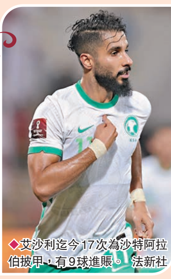
◆艾沙利迄今17次為沙特阿拉伯披甲，有9球進賬。