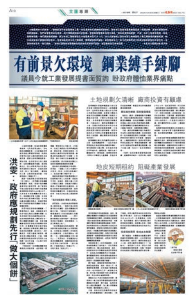
◆香港文匯報昨日出版專題報道，揭示屯門西有鋼鐵廠因土地規劃而發展受限。

甯漢豪在書面回覆中表示，「北部都會區」發展策略會為龍鼓灘地區和屯門西的未來發展帶來新機遇，包括高增值的經濟活動。因此，局方認為應該以「交椅洲人工島」和「北部都會區」兩個發展引擎為背景，為龍鼓灘地區及屯門西研究不同的土地用途組合和布局。局方會盡快向立法會申請撥款，以啟動相關的規劃及工程研究，包括檢視不同的發展選項。目標是在30個月內完成相關研究，最早有望在2027年開展填海工程。