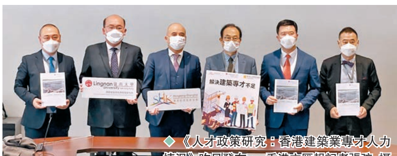
◆《人才政策研究：香港建築業專才人力情況》昨日發布。