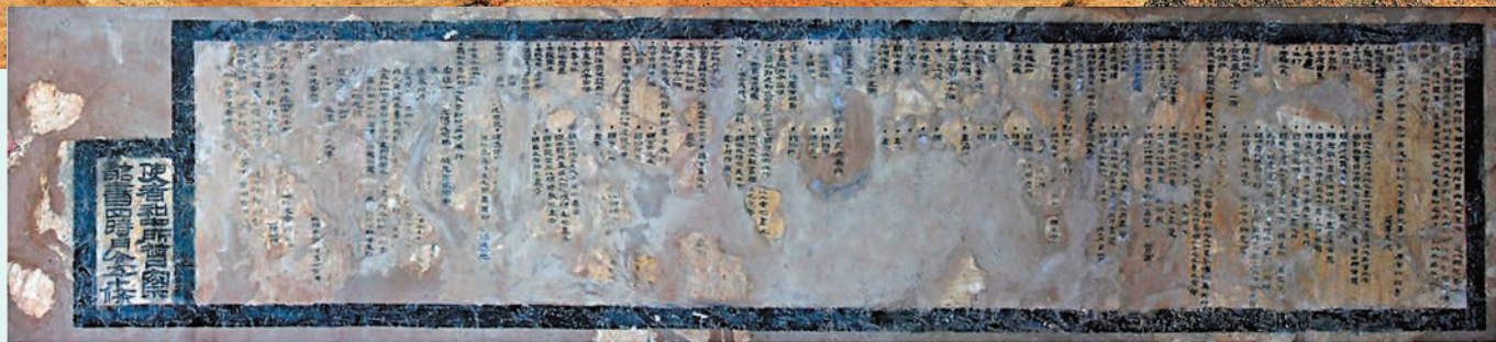
◆出土的《詔書四時月令五十條》可以稱為中國最早的環保法令。