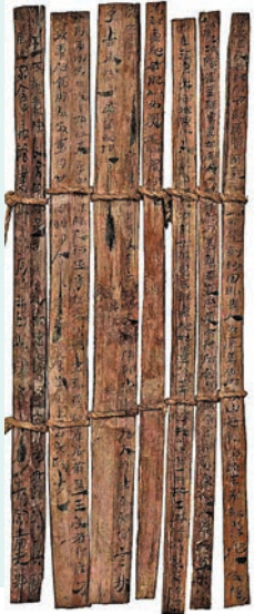
◆《案驗康居王使者獻駝冊》

從現代角度來看，當時的朝廷已經意識到了環境保護的重要性，將樹木與動物列為重點保護對象。同時也將四季的農事進行了分類，並有指導性地將每個月、每季的農業行為進行記錄，力求人類與自然能夠和諧相處。何雙全說，考古工作者在額濟納旗出土的漢簡中也曾發現相同的詔令，可見當時是發布到全國的，並在懸泉置以牆壁題記的形式進行大力宣傳，可以說是我國最早的一部環境保護法。