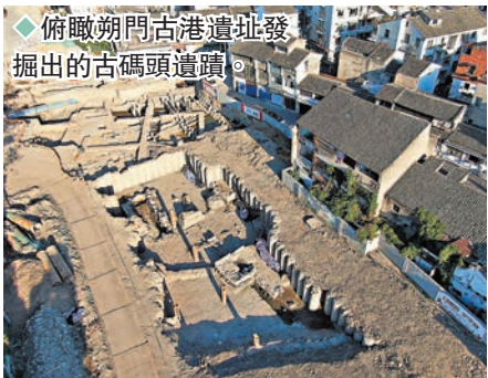
◆俯瞰朔門古港遺址發掘出的古碼頭遺蹟。

2021年底，浙江省溫州市在基建考古中發現了朔門古港遺址，省市文物考古研究所隨即對其進行了考古發掘，發現保存較好的古代建築遺蹟、沉船以及數以噸計的宋元瓷片等。9月28日，國家文物局召開發布會，通報了溫州朔門古港遺址考古重大發現，為「海上絲綢之路」研究提供重要見證。目前，考古工作人員正在對遺址進行補充性發掘，探索古港碼頭和甌江岸線的完整脈絡。