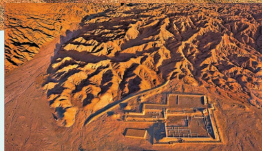
◆茫茫戈壁上的懸泉置遺址。