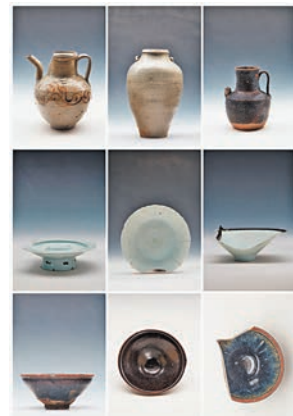
◆(下排)瓷器。這是溫州朔門古港遺址發掘出的甌窯(上排)、湖田窯(中排)、建窯