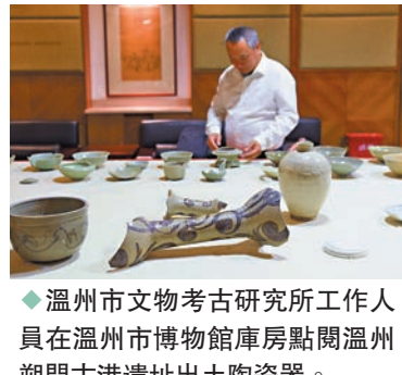
◆溫州市文物考古研究所工作人員在溫州市博物館庫房點閱溫州朔門古港遺址出土陶瓷器。