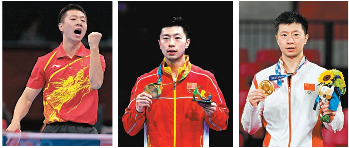
◆馬龍在倫敦奧運會一圓奧運冠軍夢。 業。 ◆馬龍在里約奧運會實現大滿貫偉業。 球迷的期望。 ◆馬龍在東京奧運會不負自己與香港

國際奧委會網站日前發布了對中國乒乓球隊隊長馬龍的專訪。過去的10年中，5枚奧運金牌，13次奪得世錦賽冠軍、金滿貫的成績讓馬龍始終處於世界頂尖選手行列，成為當代中國乒乓球的名片之一。然而展望2024年巴黎奧運，馬龍的語氣卻有點不確定，只表示不到退役，不說放棄。