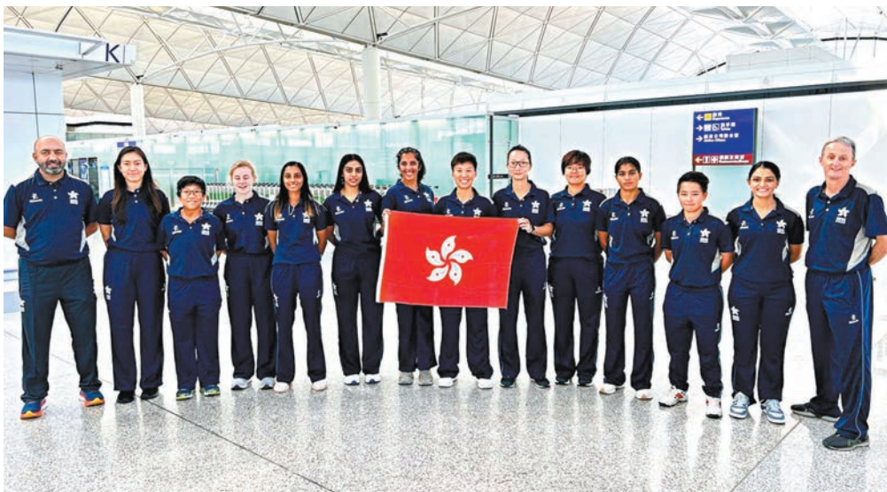
◆港隊昨日出發並已到達日本。香港板球圖片