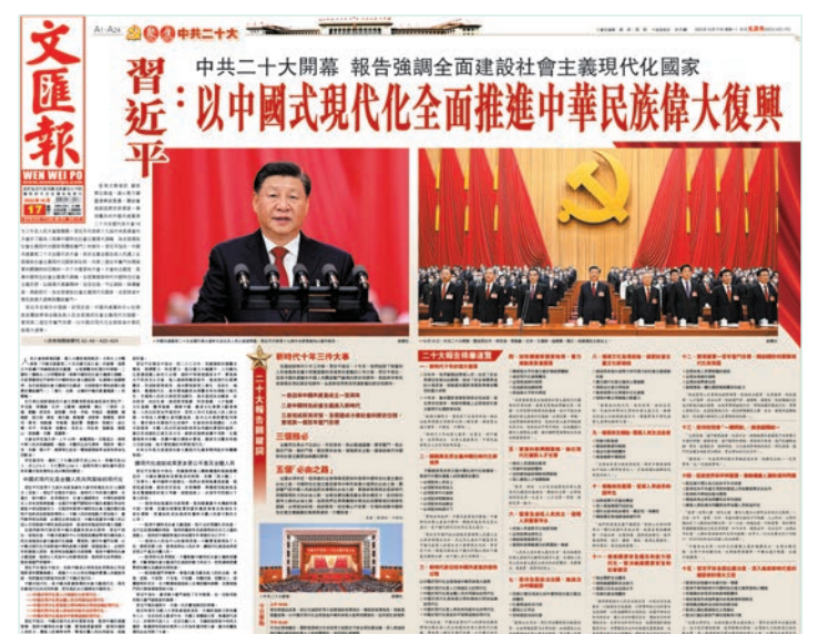
◆香港《文匯報》重磅報道中共二十大開幕的重要內容。 香港文匯報版面PDF