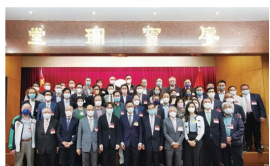
◆香港潮州商會舉行會董會專題演講。

香港潮州商會日前舉行會董會專題演講，邀請律政司副司長張國鈞蒞臨該會禮堂主講，題為「香港法律制度及九七回歸後的法治建設」。該會會長馬鴻銘代表香港潮州商會全體同仁對張國鈞的蒞臨表示熱烈的歡迎和衷心的感謝。