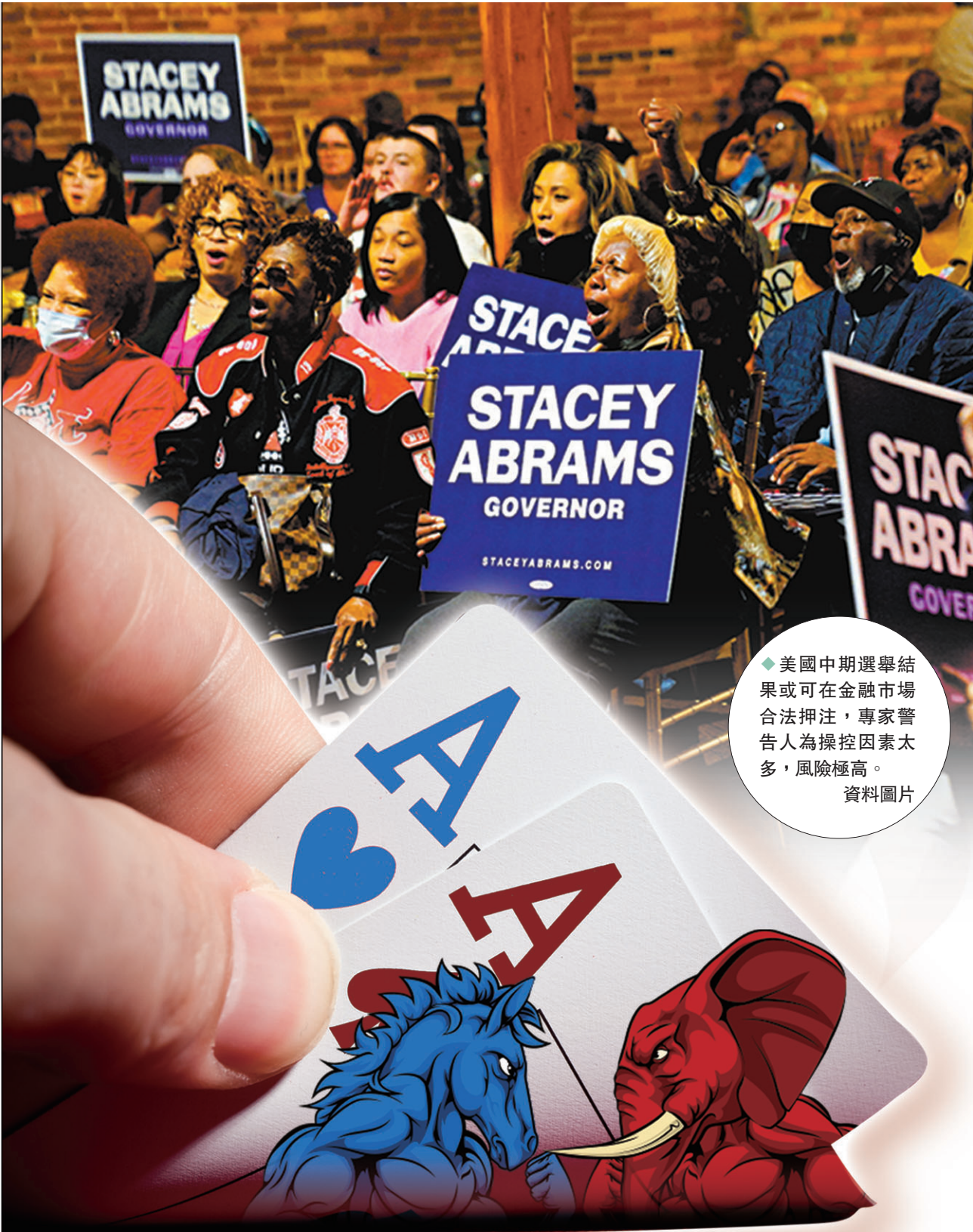
◆美國中期選舉結果或可在金融市場合法押注，專家警告人為操控因素太多，風險極高。 資料圖片