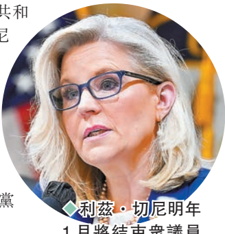
◆利茲·切尼明年1月將結束眾議員任期。

斯特洛金所在的密歇根州第7選區競爭激烈，共和黨將當地視為重奪眾院多數席位的主要目標之一。據報該選區的共和黨候選人巴雷特拒絕承認前年大選結果，加上斯特洛金主張兩黨合作，都讓利茲·切尼下定決心「調轉槍頭」。在本月初，利茲·切尼還呼籲亞利桑那州選民，不要投票給拒絕承認今次中期選舉結果的共和黨候選人。 ◆綜合報道