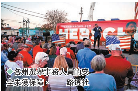
◆各州選舉事務人員的安全未獲保障。

CNN統計顯示，亞利桑那州等7個搖擺州報稱有選舉官員受暴力威脅的個案，佔全美整體個案約60%。然而這7個州份僅收到略多於100萬美元(約784萬港元)的撥款，用於保障選舉官員人身安全。部分資金從批出到完成分配甚至長達數年，例如2022財年計劃批出的資金，恐怕要到2024年