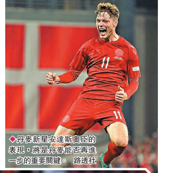
◆丹麥新星安達斯基斯甸臣的表現，將是丹麥能否再進一步的重要關鍵。