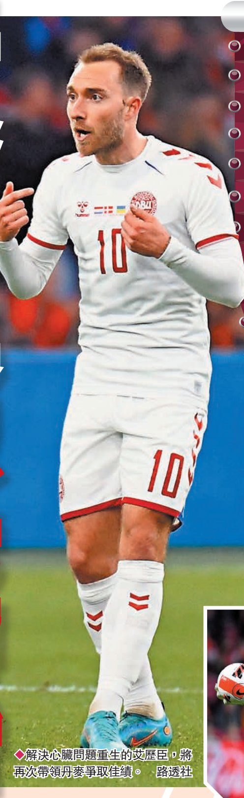
◆解決心臟問題重生的艾歷臣，將再次帶領丹麥爭取佳績。