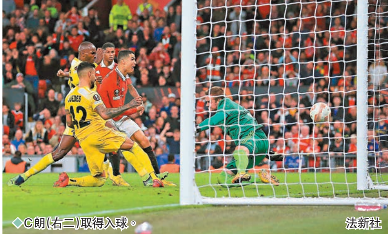
◆C朗(右二)取得入球。

香港文匯報訊(記者 楊浩然)歐霸盃於香港時間周五凌晨上演多場分組賽，其中E組曼聯派出早前被內部停賽的C朗拿度正選上陣，這位葡萄牙巨星亦取得一個入球，協助「紅魔鬼」主場以3球淨勝舒列夫，提早獲得出線資格。 由於對熱刺比賽拒絕後備上陣，C朗拿度在上周對車路士聯賽被領隊坦哈格處分內部停賽，但據報這位葡萄牙巨星於過去周二作出道歉，最終獲解凍在今場正選上陣，結果C朗亦於下半場取得入球，助曼聯以3:0獲勝，賽後5戰得12分成功獲得E組出線權，將於下輪和皇家蘇達達爭逐首名資格。 雖然關係被指破裂，但坦哈格賽後亦十分識做，大讚全場表現積極的C朗：「C朗全場積極希望爭取入球，這亦是他整個職業生涯在做的，最終獲得了回報；我認為他只是欠了點信心，現在入球出現了，他之後必可取得更多入球。」 同日其他比賽，A組阿仙奴意外作客以0:2不敵燕豪芬，但仍以5戰得12分排此組榜首。至於C組羅馬作客以2:1險勝赫爾辛基，下輪只要主場擊敗盧多格德斯，便有望以次名身份出線。