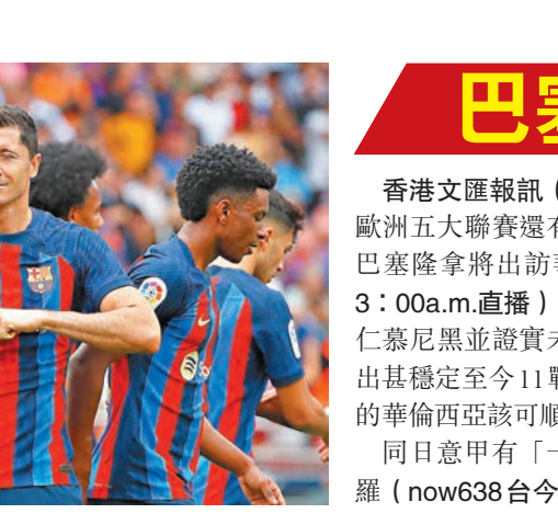
▶巴塞在西甲表現較出色。 美聯社

里上週聯賽作客擊敗羅馬，過去周中歐聯又輕取格拉斯哥流浪，至今已累積12連勝，面對近3戰2負的薩索羅當有力再下一城。 至於法甲巴黎聖日耳門主場對近4戰不勝的特魯瓦(now639台今晚11:00p.m.直播)，就算輪換相信亦可言勝。至於德甲拜仁慕尼黑主場對3連勝的緬恩斯(香港時間今晚9:30p.m.開賽)，相信要花一些功夫才可全取3分。