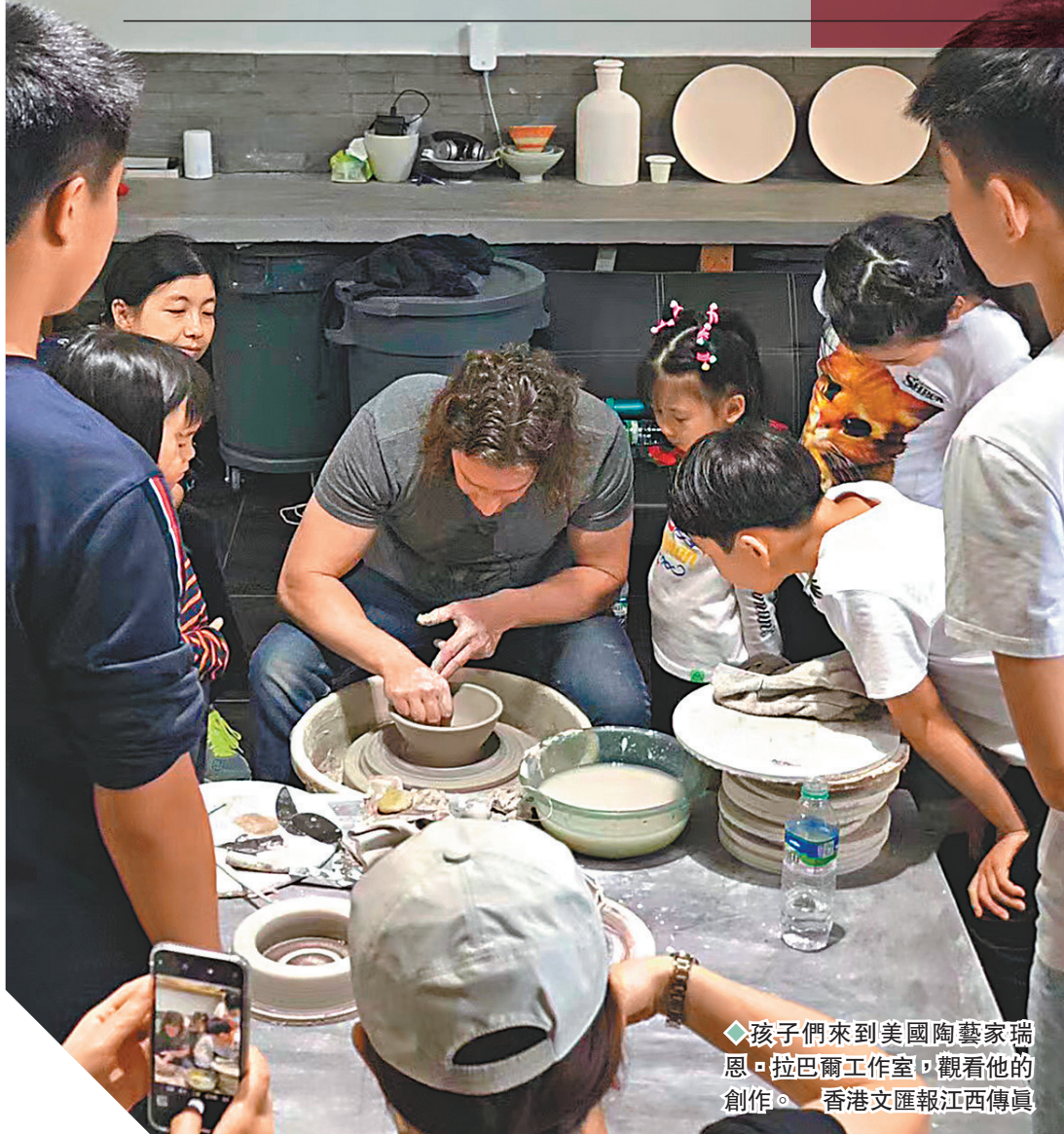
◆孩子們來到美國陶藝家瑞恩·拉巴爾工作室，觀看他的創作。

瑞恩·拉巴爾則乾脆改變了自己的美式飲食習慣，迷戀上了江西美食，江西米粉、興國米粉魚、景德鎮冷粉、鹹水粿、餃子粿。他也愛與這裏的人交朋友，他會去貼近市民生活的大排檔吃飯，還學會了和朋友們在微信聊天。「我想樹立一個外國人在中國生活的榜樣，讓大家進一步了解真實的中國。」他說。