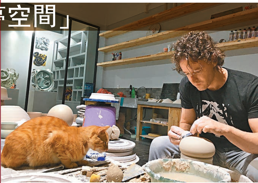
◆美國陶藝家瑞恩·拉巴爾在創作。