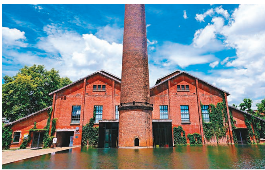
▲如今的宇宙瓷廠，從外表看，老廠房、老窯爐、煙囪、水塔依然聳立，但是它們的結構已改造，功能和業態也已經重新塑造。