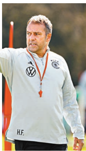
◆費歷克首次帶領德國隊出戰國際大賽。

前鋒：艾迪耶美(多蒙特/德甲)、夏維斯(車路士/英超)、迪姆華拿(RB萊比錫/德甲)、基拿比(拜仁慕尼黑/德甲)、湯馬士梅拿(拜仁慕尼黑/德甲)、利萊辛尼(拜仁慕尼黑/德甲)