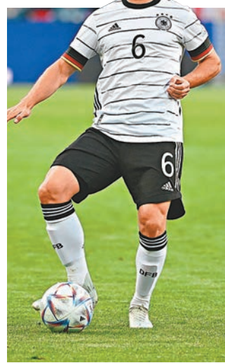
◆甘美治組織和串聯能力不容懷疑，只是攔截方面卻非其強項。

達碧克，活力有餘惟大賽還需累積經驗，右開更似乎尚未找到必然正選，泰路基拿和莊拿斯荷夫曼都是有力競爭者。