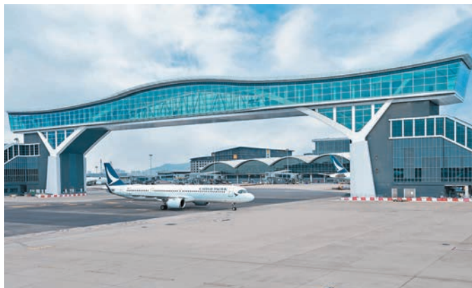
◆「天際走廊」全長200米、高28米。