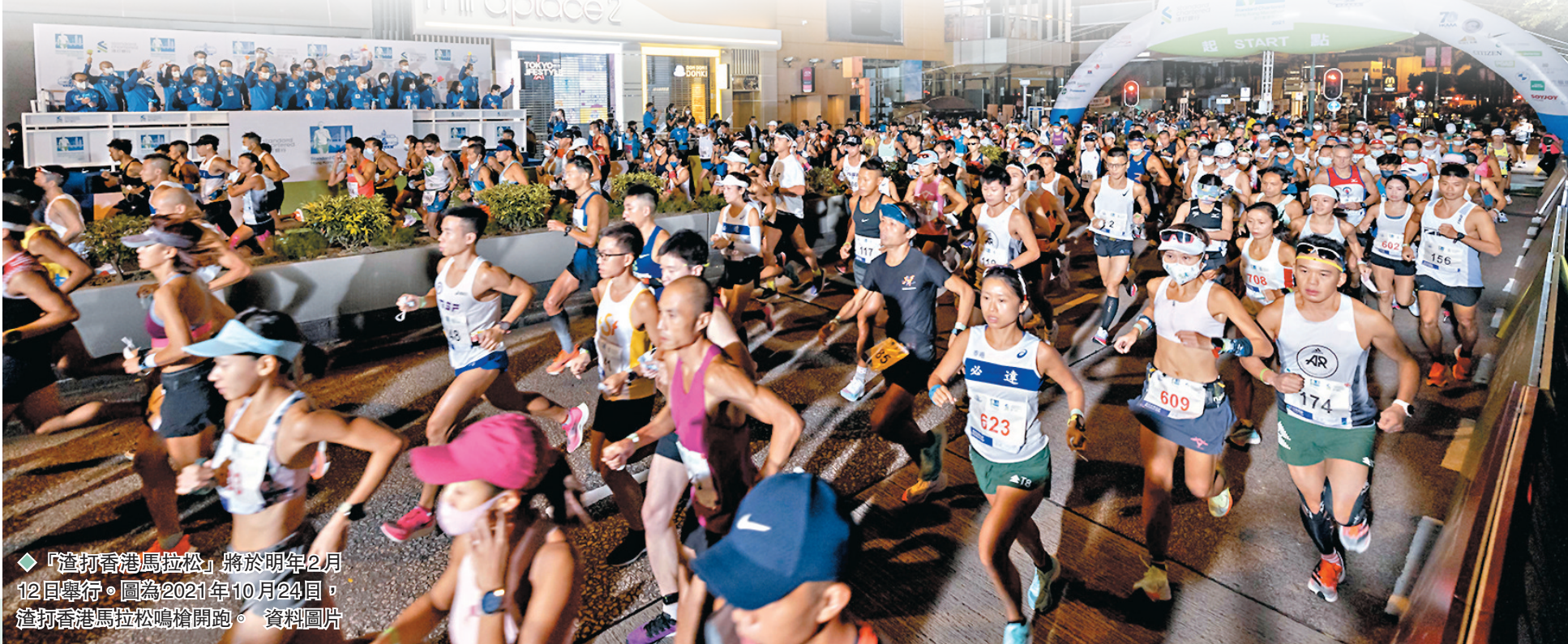
◆「渣打香港馬拉松」將於明年2月12日舉行。圖為2021年10月24日，渣打香港馬拉松鳴槍開跑。

原定於今年11月20日舉行的渣馬一波三折下終確定延至明年2月12日舉辦，主辦單位昨日於啟動儀式上公布更多比賽詳情，賽事將繼續分為10公里、半馬拉松及馬拉松三個組別，暫定參賽名額分別為13,000、6,000及6,000個，而比賽路線方面則沿用傳統路段，半馬及全馬由尖沙咀彌敦道出發，而10公里賽以東區走廊為起點，參賽跑手亦須遵循多項防疫措施，包括賽前48小時進行核酸檢測、比賽當日到場前進行快測陰性、必須符合疫苗通行證的要求、以及呈「藍碼」者方可參賽。