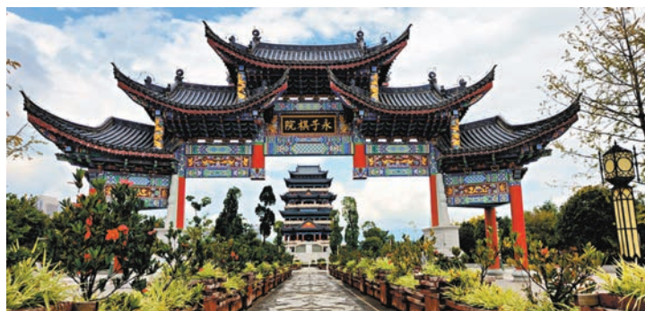
「世界第一棋閣」保山永子棋院。