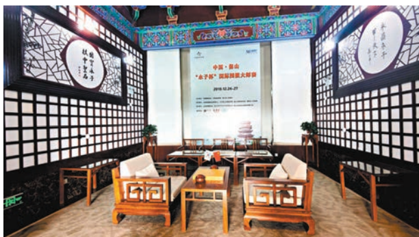
保山永子棋院的巔峰對決廳，通常僅供圍棋九段高手對弈。