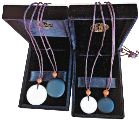
取永子黑白棋子各一顆，打孔纏繩即成掛壁。