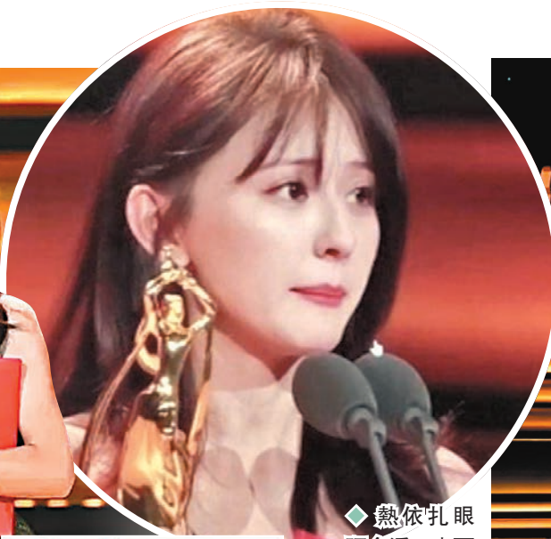
熱依扎眼眶含淚，畫面動人。