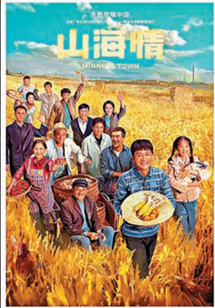
《山海情》以現代農村脫貧為題材的電視劇。