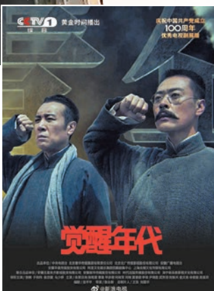
《覺醒年代》屬一部歷史題材電視劇。

本屆頒獎典禮分為「春天·我們的」、「榮譽·人民的」、「未來·是中國的」三個篇章，在頒獎表彰、領獎代表分享創作經驗的同時，穿插詩朗誦、歌曲、交響音畫等文藝表演，唱響奮鬥揚帆新征程的時代主旋律。今屆飛天獎的獲獎作品以現實題材為主，《山海情》、《覺醒年代》、《跨過鴨綠江》及《功勳》等16部作品在此次評選中脫穎而出。