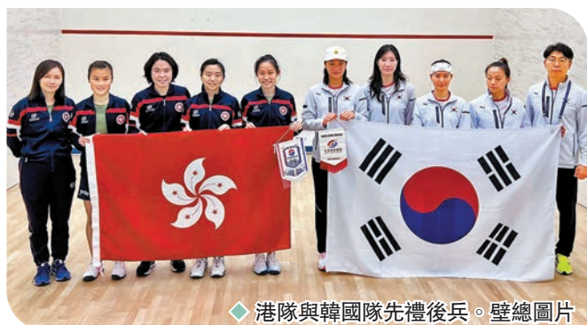
◆港隊與韓國隊先禮後兵。壁總圖片