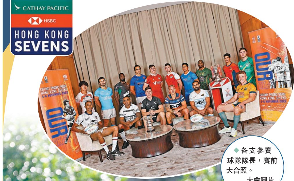
◆各支參賽球隊隊長，賽前大會圖片