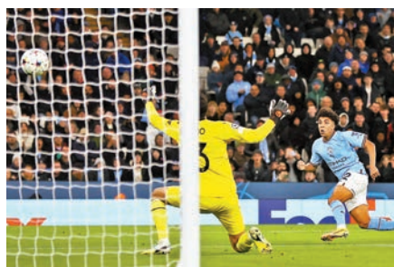
◆新秀尼高李維士(右)下半場為曼城追成1:1，寫下紀錄。

孫興民眼眶骨裂動刀 戰世盃存變數 英超球隊熱刺昨日證實，陣中韓國國家隊的鋒線球星孫興民，在日前歐聯所受的傷，其左眼附近骨裂將需接受手術治療。這將讓他代表韓國隊出戰世界盃增添變數。 熱刺日前歐聯以2:1擊敗馬賽，在最後一輪分組賽成功取得16強出線權，但孫興民上半場在一次同對手的爭頂中被撞傷面部。熱刺在聲明中說：「我們可以證實的是，孫興民將接受手術，將左眼周圍骨裂的地方固定。」聲明續道：「手術後，孫興民將在我們的醫療人員協助下作恢復治療，我們會在適當時間向球迷更新他的狀況。」 至於孫興民何時能歸隊，熱刺方面並沒有給出時間表，但他本來將要代表韓國隊參加20日展開的世界盃決賽周，首輪分組賽是24日對陣烏拉圭，可供這位球隊王牌前鋒養傷的時間已經不多。