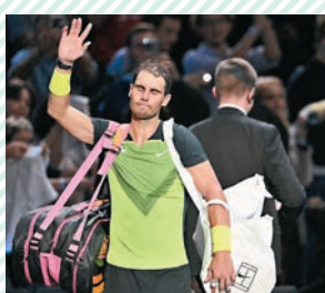
◆拿度(左)休息兩個月後的首場比賽發揮欠佳。

西班牙網球天王拿度喜獲麟兒後出師不利，在當地時間2日的巴黎網球大師賽第2輪苦戰3盤，最終不敵美國球手湯美保羅。這是拿度和太太以及剛出生的兒子在家鄉馬略卡共享天倫之樂兩個月後，首次踏上男單賽場，貴為賽會第2種子的他首輪輪空，結果在第2輪出戰便敗北。拿度賽後表示：「拿下第1盤，第2盤又被發後，我原本已經勝券在握，但之後的那局我打得糟透了。關鍵時刻打那麼差，我確實不配贏球。」