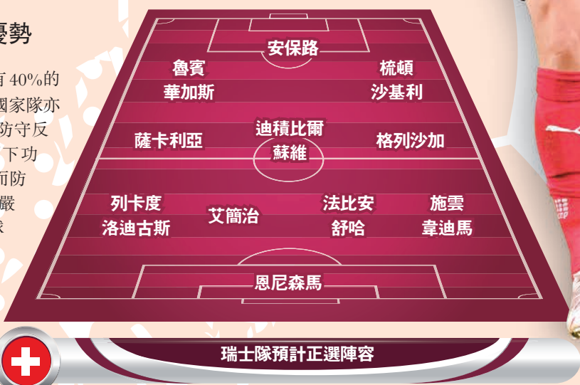
瑞士隊預計正選陣容

◆梅勒耶堅 雖然之前的執教履歷大都是瑞士國內的球會，然而他去年接手後由三中堅改踢四後衛，球隊表現依然穩健。