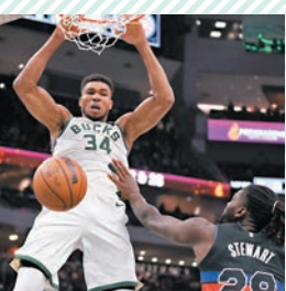
◆阿迪圖尼保「入樽」得分。

美職籃(NBA)當地時間2日展開11場較量，依靠「字母哥」阿迪圖尼保32分、12個籃板和4次助攻的出色發揮，密爾沃基公鹿以116:91大勝底特律活塞，獲得7連勝，新賽季至今未嘗敗績。由於兩隊實力存在一定差距，公鹿開局就佔據場上主動，首節以31:26領先。次節，「字母哥」延續穩定發揮，帶領球隊持續保持優勢，半場領先56:47。第3節，公鹿繼續將分差拉大，而大比分落後的活塞末節亦未能組織起有效反擊。