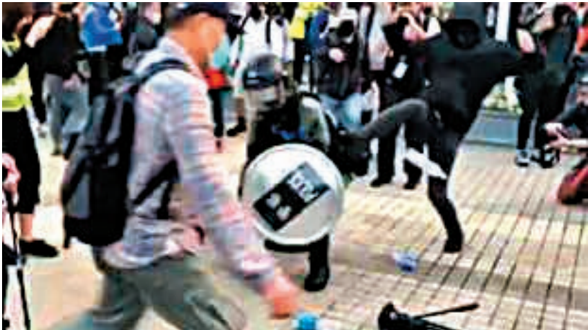
◆2019年「學生歷量」在中環舉行鼓吹分裂國家的集會，其間有暴徒拆走國旗及引發暴亂，一名男生飛踢一名高級督察腰背。