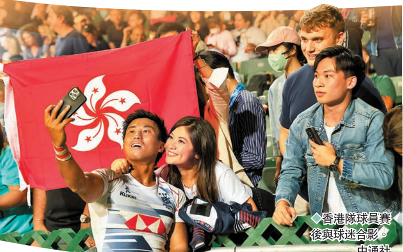
◆香港隊球員賽後與球迷合影。