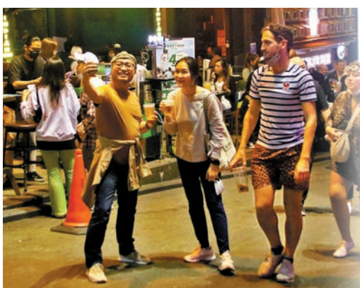
◆中環蘭桂坊一帶酒吧被七欖帶旺。