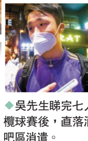
◆吳先生睇完七人欖球賽後，直落酒吧區消遣。潘先生(右)及朋友。

香港酒吧業協會主席錢萬永昨日接受香港文匯報訪問時表示，業界近日生意額較以往增加約三成，業界亦普遍增聘人手及增購酒水等物資以應付需求，希望香港舉辦更多大型國際賽事，「希望旅遊局大力支持七欖等國際活動舉行，讓香港有更多的活力，吸引更多遊客來玩。」