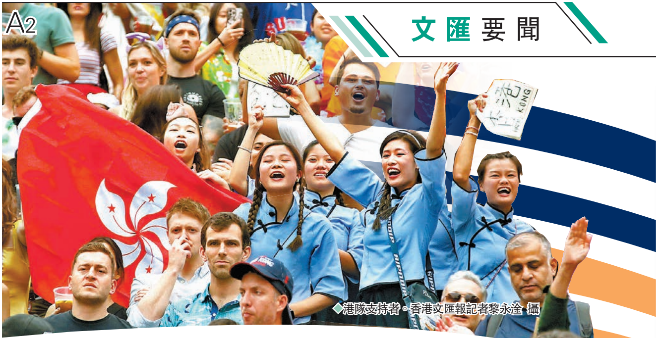
◆港隊支持者。