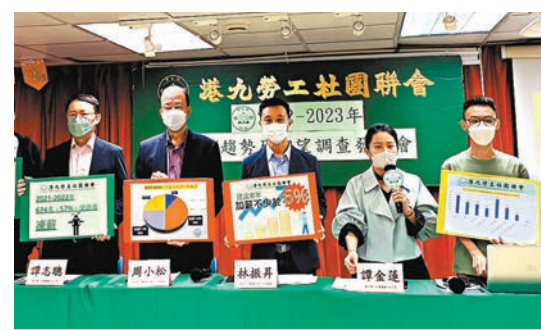
◆勞聯建議，來年僱員加薪幅度不少於6%。

勞聯指，隨着入境檢疫放寬至「0+3」，估計旅遊、飲食、酒店等行業最需增聘人手。立法會議員、勞聯主席林振昇表示，是次調查反映不少打工仔並不滿意今年度的薪酬調整幅度，期望來年可以改善，再加上早前公務員及多間大型企業也有加薪，且最低工資有望上調，均令僱員對未來的加薪幅度有較高期望。他指出，疫情雖然仍未完結，部分行業未復常，但期望有盈利能力的企業，能夠與員工分享成果。