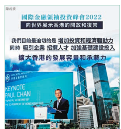
◆陳茂波表示，國際金融領袖投資峰會成功舉辦，向世界展示香港的開放及復常目標。