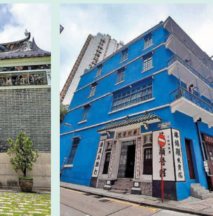
香港旅遊發展局網站圖片