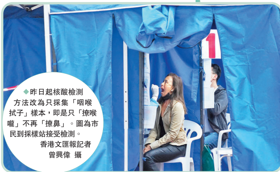
◆昨日起核酸檢測方法改為只採集「咽喉拭子」樣本，即是只「擦喉嚨」不再「擦鼻」。圖為市民到採樣站接受檢測。