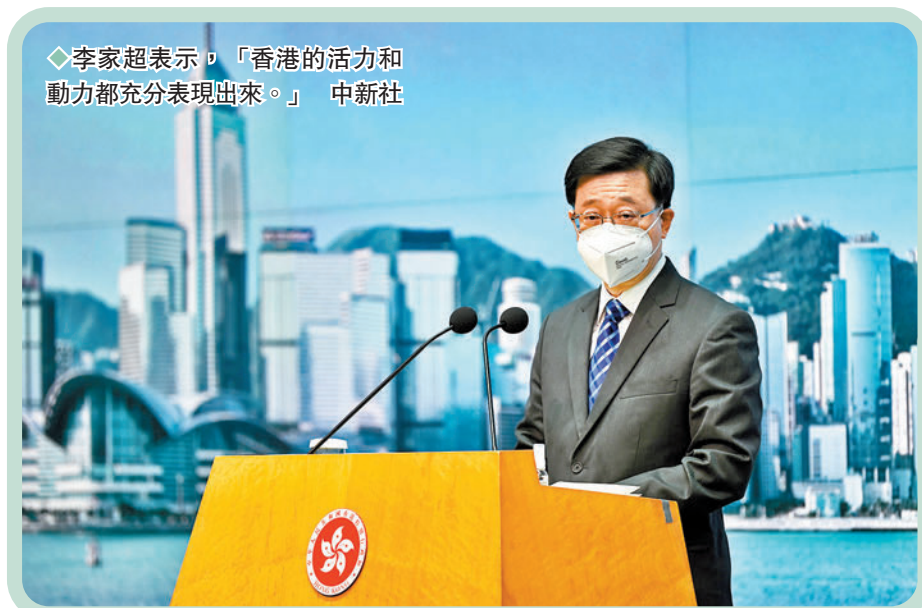
◆李家超表示，「香港的活力和動力都充分表現出來。」

至於與內地正常通關方面，李家超指特區政府仍然全力跟內地有關單位商討，包括「逆向隔離」措施，「內地的防疫需要是重要的，我們在不影響內地的防疫標準，亦不增添內地防疫方面的額外風險下，仍然跟內地單位商討這方面的安排。」