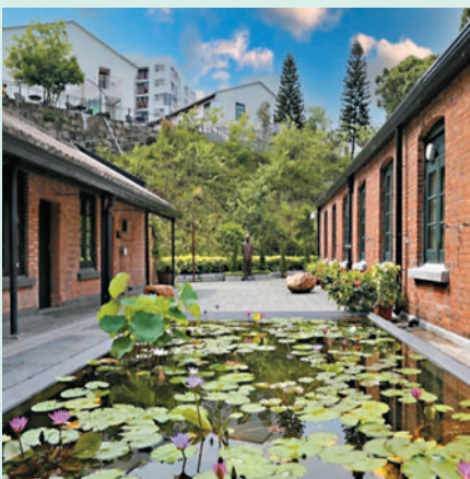
◆為配合特區政府推動文化和古蹟旅遊，新一輪「賞你遊香港」新增歷史古蹟主題本地遊。左起：荔枝角饒宗頤文化館、新田大夫第、灣仔藍屋。

新一輪「賞你遊香港」分兩批推出，合共提供6.4萬個名額，第二批約170個行程將於本月下旬推出。市民只需於本地零售及餐飲商戶的實體店舖消費滿800元，即可儲起機印收據（最多兩張，2022年10月20日或之後發出），免費換取本地遊名額一個，或額外付費參加「尊尚旅行團」。