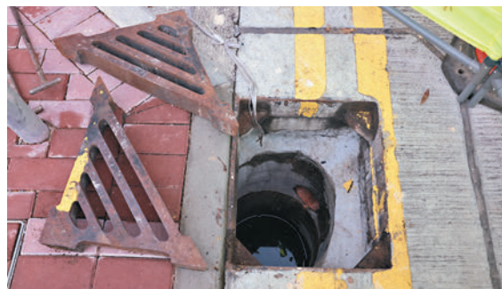
◆現場所見，涉事坑渠直徑約0.3米闊。