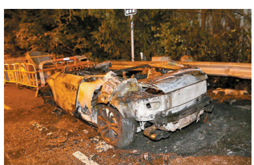
◆涉嫌車禍後不顧而去的私家車，數小時後在屯門被發現遭縱火燒毀。

香港文匯報訊(記者 蕭景源)元朗發生冷血車禍，一名14歲男生前晚離開灰沙圍村寓所扔垃圾，遭一輛私家車撞飛十多米，頭部及手部