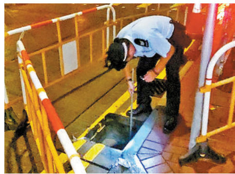
◆事後警員用鐵枝從坑渠內搜尋事主銀包。