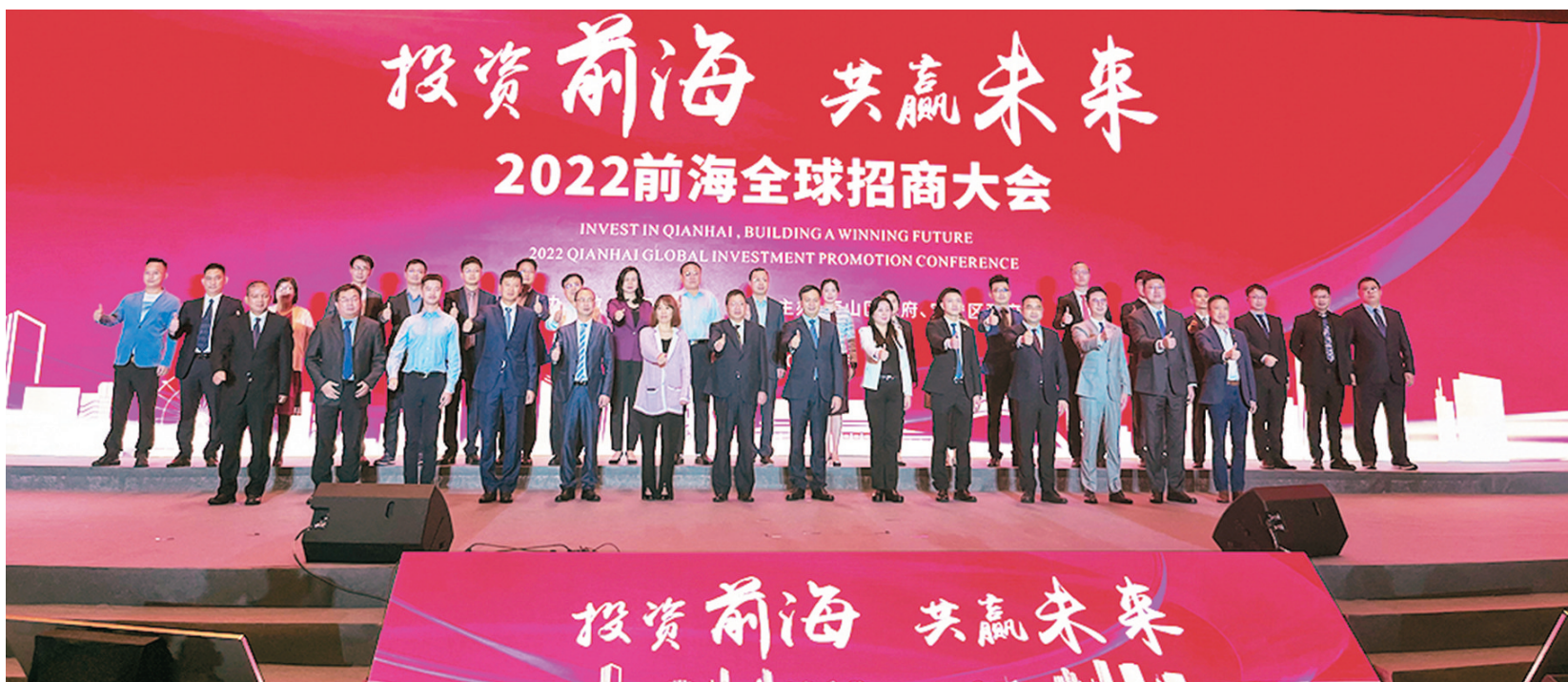
◆2022年前海全球招商大會舉行，活動吸引總投資金額超1,200億元的项目落地。