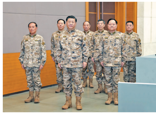
◆2022年11月8日，習近平視察軍委聯合作戰指揮中心。